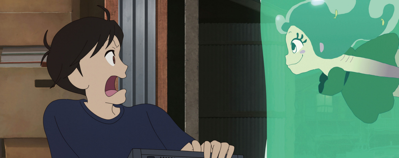
Fig. 6. Fotograma de Lu Over The Wall , 2018. Masaaki Yuasa.

del 55FICX. Quizás es una técnica más dada a la experimentación, con menos necesidades técnicas, o más barata de producir. Por otra parte, la rotoscopia es frecuente en la animación para adultos, y un recurso de bajo presupuesto que puede sustituir a la imagen real para hablar de la propia realidad posibilitando otros discursos. El lenguaje de las primeras películas animadas y los mecanismos sencillos de estas primeras producciones sigue sirviendo para contar historias en pleno siglo XXI. Por su parte, el anime continúa siendo un referente en la animación 2D contemporánea, y cuenta con un público fiel que sabe leer sus códigos. Además, los motion graphics suelen utilizar esta técnica. En este 55FICX los cartones antes de las películas consistían en una sencilla animación: un dedo pulsa el botón que activa la pantalla. 6