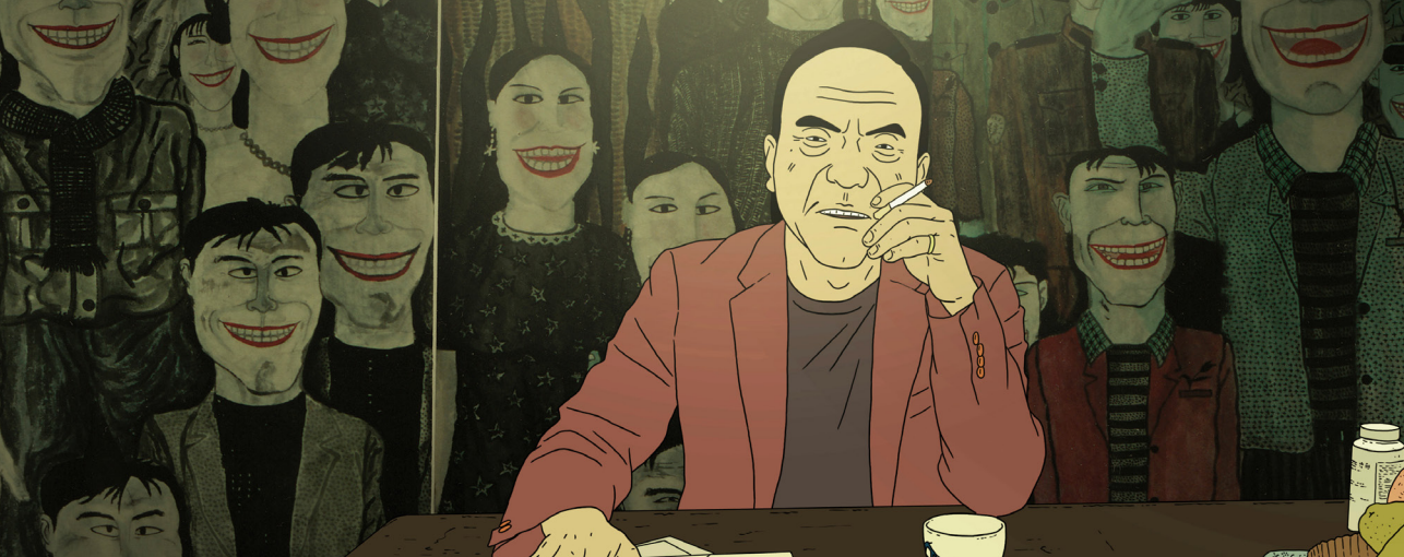
Fig. 1. Fotograma de Have a Nice Day , 2017. Liu Jian.