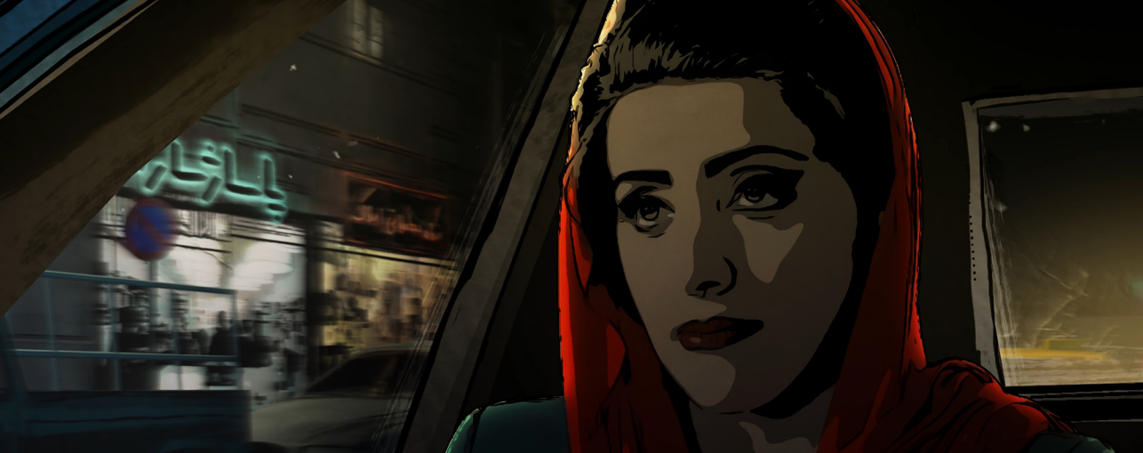
Fig. 4. Fotograma de Tehéran Tabou , 2018. Ali Soozandeh.

su papel en la sociedad, cuál su sufrimiento. 4 “Al realizar esta película, quería romper el silencio que es práctica habitual en Irán. Diría que romper tabús es una forma de protestar contra las restricciones”. 5