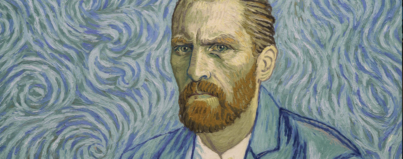
Fig. 3. Fotogramas de Loving Vincent , 2018. Dorota Kobiela.