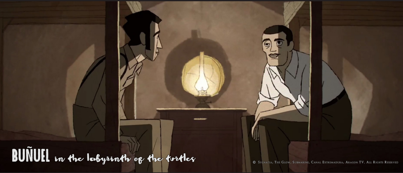
BUÑUEL in the labyrinth of the turtles