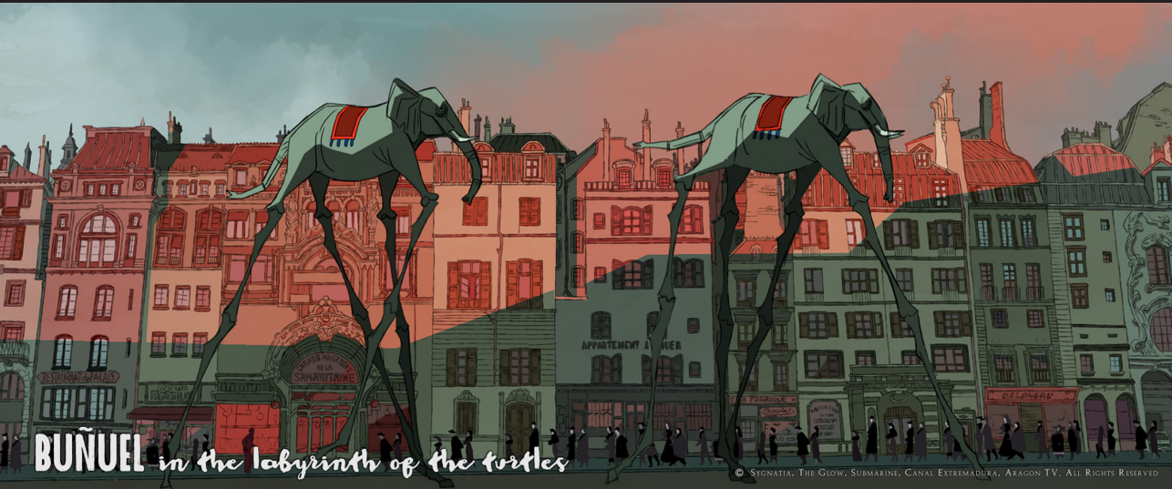
BUÑUEL in the labyrinth of the turtles