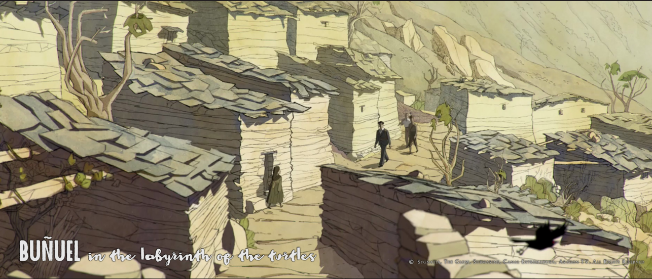
BUÑUEL in the labyrinth of the turtles