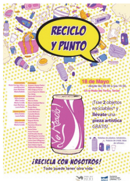
Figura 1: Diseño del cartel para la difusión del evento (en proceso).