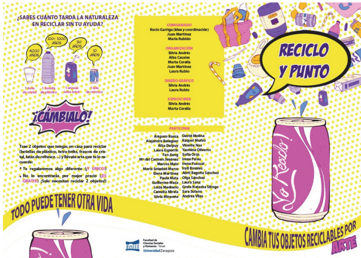
Figura 2. Diseño del exterior del tríptico para “reciclo y punto” (en proceso)