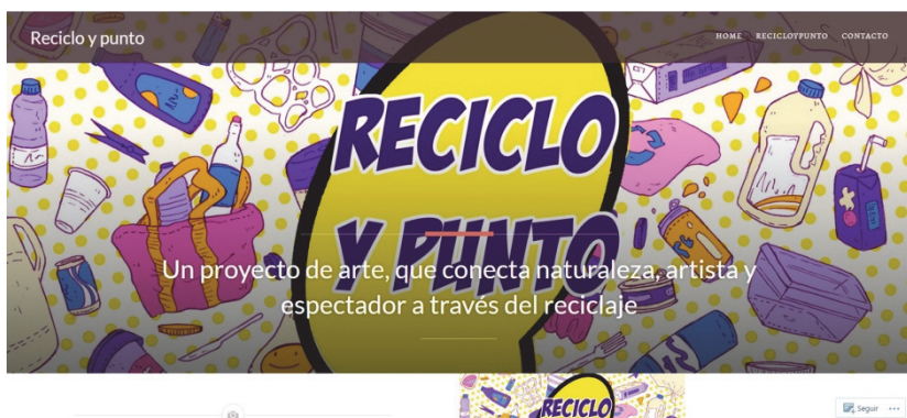
Figura 4. Captura de pantalla del espacio web creado por los estudiantes de Diseño y Gestión.

Para los estudiantes de 'Diseño y Gestión' la evaluación de este ejercicio consistió en la presentación del proyecto a los estudiantes de la asignatura 'Volumen I', una acción que debía tener apoyo visual y durar entre 30 y 45 minutos.