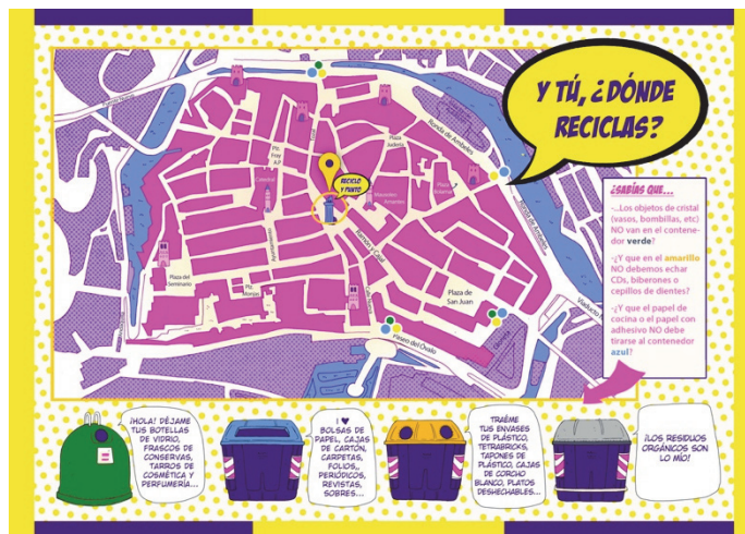
Figura 3. Diseño del interior del tríptico para “reciclo y punto” (en proceso)