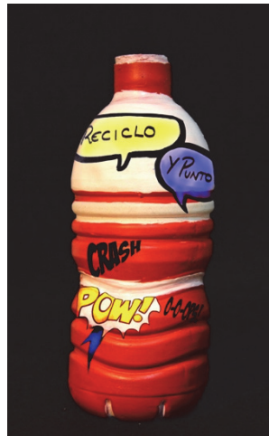
Figuras 9 y 10: Recreaciones de los objetos finales realizadas por los estudiantes de Diseño y Gestión para mostrar acabados posibles a los alumnos de Volumen I.

Una vez hecha la presentación del evento, los estudiantes de Volumen I vieron definidas las pautas del ejercicio que debían llevar a cabo. Cada uno de ellos debe elaborar un molde en escayola de un objeto reciclable simétrico (botellas de