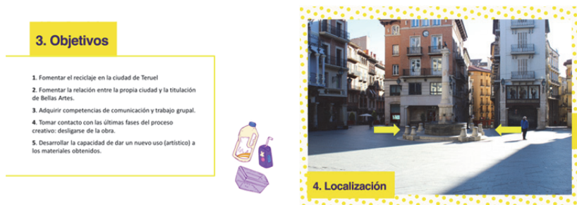
Figuras 5 y 6. Diapositivas de la presentación realizada por los alumnos de Diseño y Gestión a los de Volumen I.

Para los estudiantes de 'Diseño y Gestión' la evaluación de este ejercicio consistió en la presentación del proyecto a los estudiantes de la asignatura 'Volumen I', una acción que debía tener apoyo visual y durar entre 30 y 45 minutos.