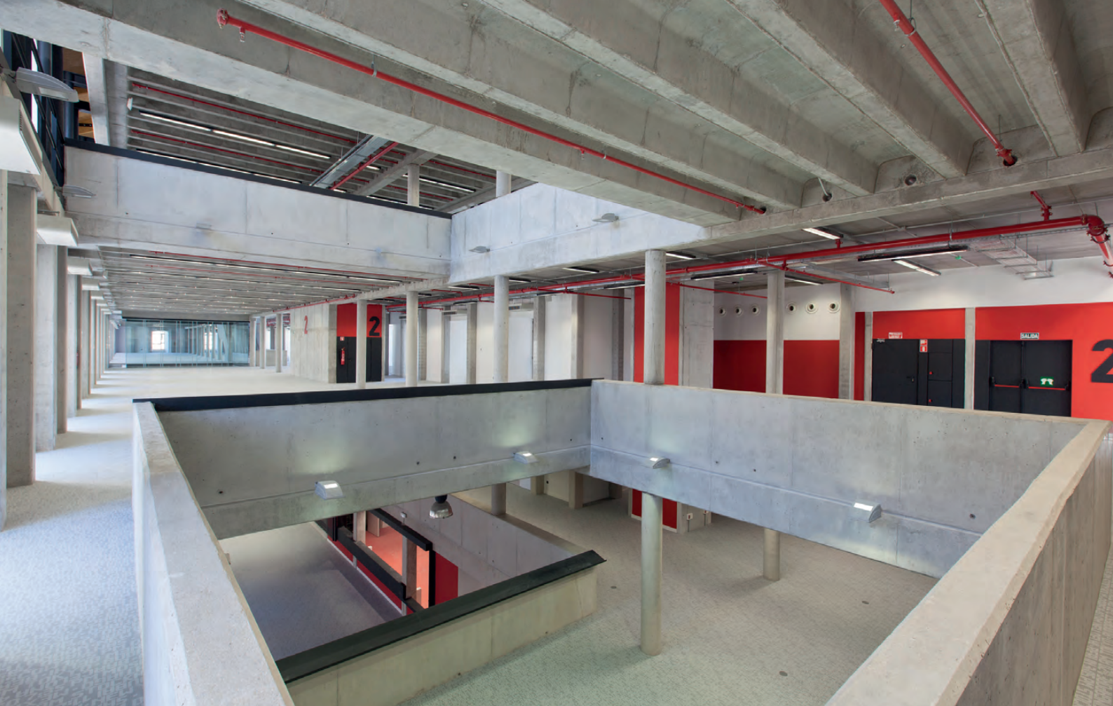
Figura 1. Vista interior del CRAI. ©Bernardo Corces / Figure 1. Interior LCR view. ©Bernardo Corces.