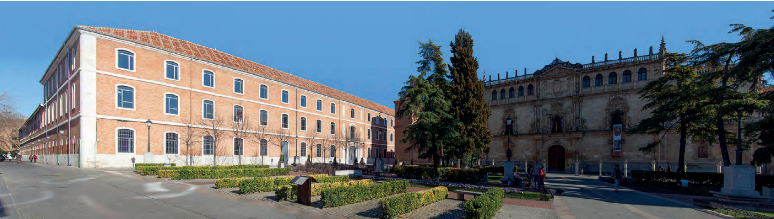
Figura 3. Vista del CRAI en la Plaza San Diego. ©Bernardo Corces / Figure 3. LCR view from Plaza San Diego. ©Bernardo Corces.

proyecto ha estado desde el inicio muy condicionado por las restricciones económicas propias de los actuales tiempos de crisis. Desde el primer momento se ha sido consciente de que la inversión prevista para el edificio no podía desviarse por falta de fondos adicionales. Muchas de las opciones de proyecto han sido condicionadas por esta premisa, como el maximizar los espacios disminuyendo los sectores de incendio, o el prescindir de revestimientos en acabados e instalaciones. El coste final del edificio se sitúa en torno a los 1100 Euros/m 2 , muy por debajo de lo habitual en este tipo de edificios públicos, con una desviación sobre el presupuesto de contrata de un 0,05% (Fig. 5).