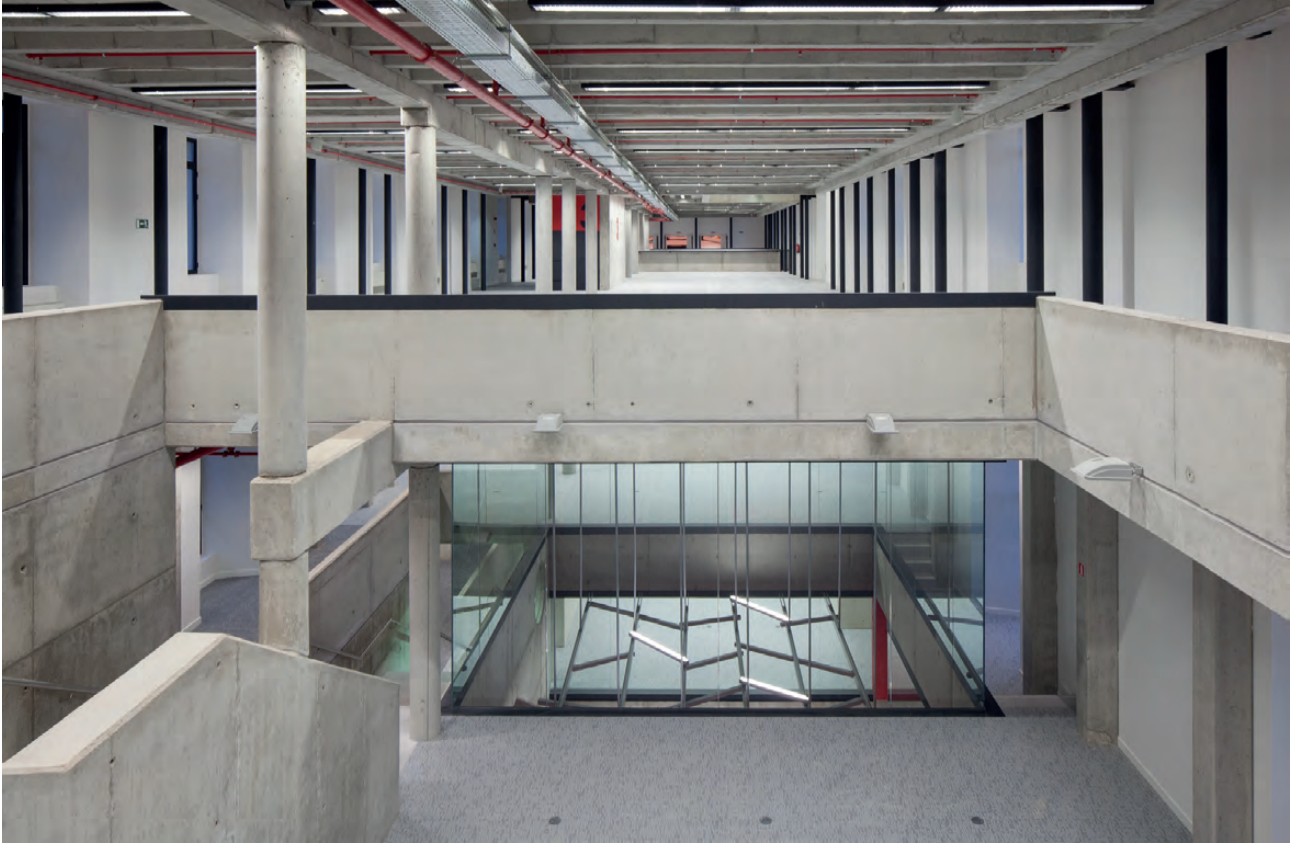
Figura 7. Interior CRAI. Vista desde planta 3ª. / Figure 7. Interior LCR view from 3th floor.