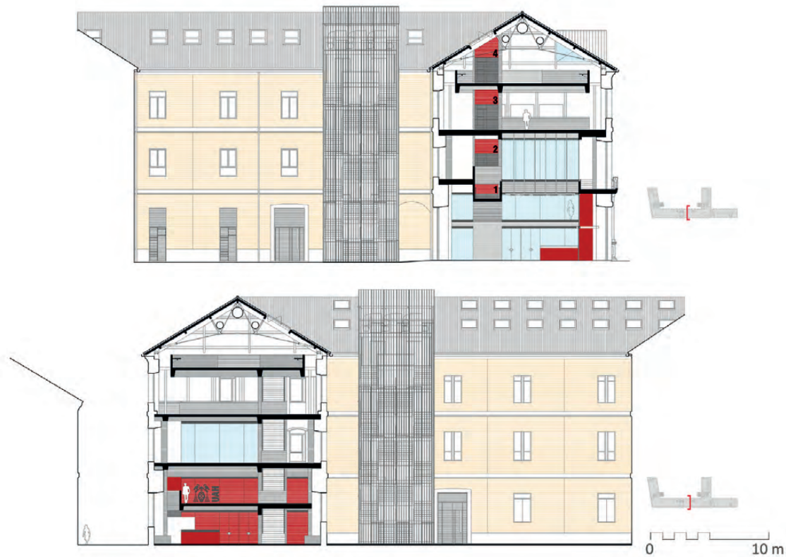
Figura 6. Secciones transversales del CRAI. CDE Arquitectura / Figure 6. LCR section. CDE Arquitectura.