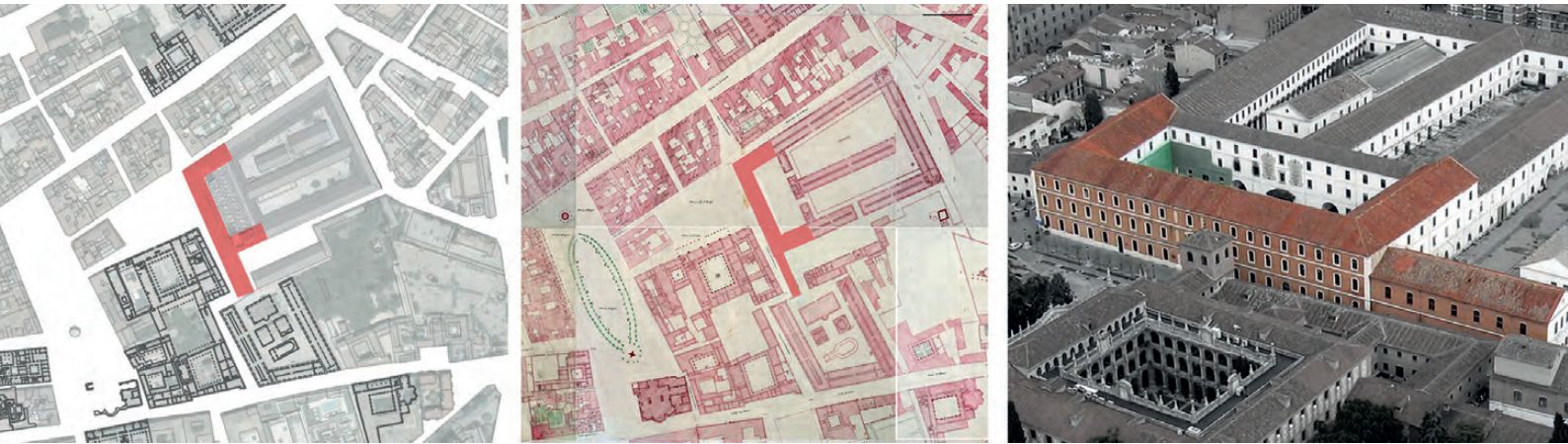
Figura 2. Plano de situación, plano histórico s.XIX y vista del cuartel antes de la intervención / Figure 2. Site plan, historic plan XIX century and barrack view before intervention.