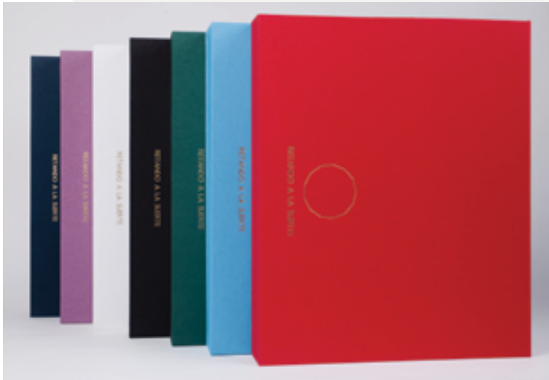
Proyecto Retando a la suerte.