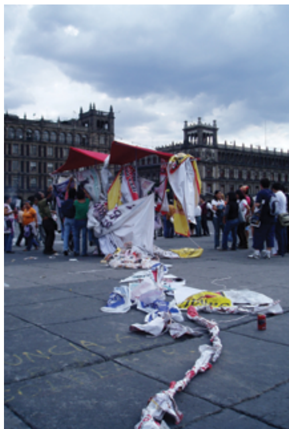
Centro Portátil de Arte Contemporáneo-CPAC.