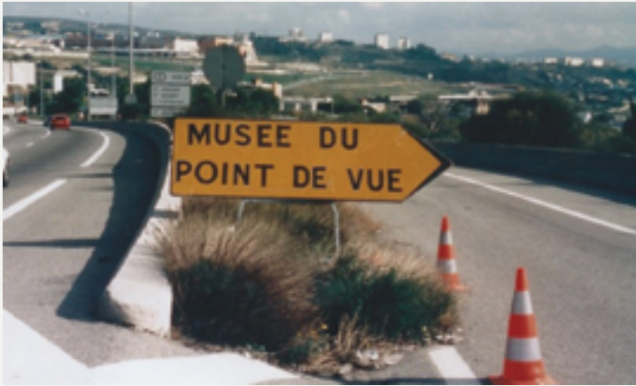
Musée du point de vue.