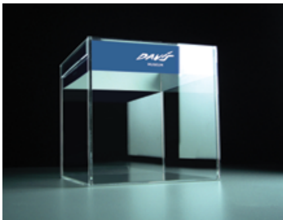
Davis Museum.