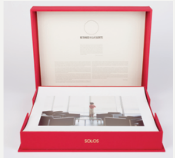
Segunda Caja Proyecto Retando a la suerte.

duración de su exposiciones suele ser, por ejemplo, de nueve horas y quince minutos—. El JEMA, en palabras de su creador, permite pensar de forma diferente sobre la naturaleza del arte y la práctica artística.