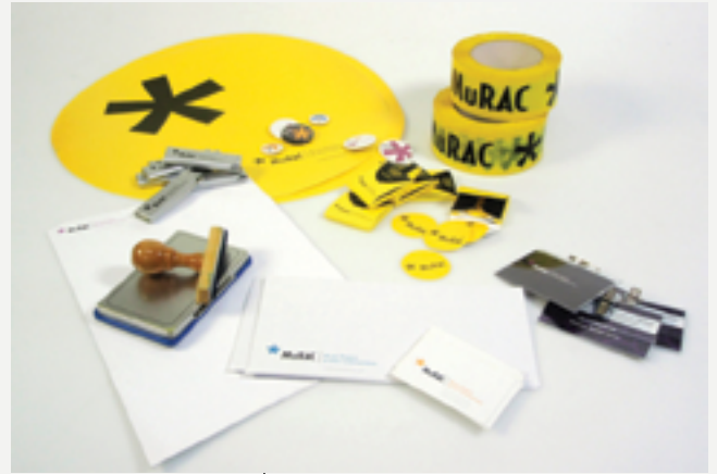
Merchandising y papelería del Museo Riojano de Arte Contemporáneo MURAC.