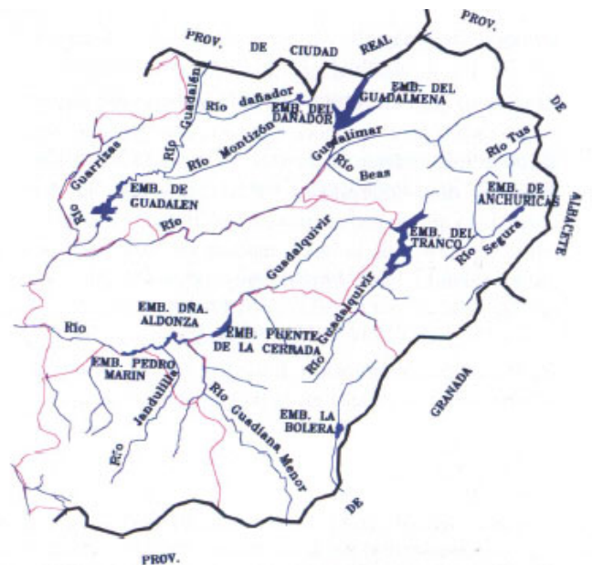
Figura 2. Hidrografía de las comarcas de El Condado, La Loma, Sierra Mágina, Sierra de Segura y Sierra de Cazorla.

Las comarcas de Sierra de Cazorla y de Sierra de Segura constituyen la cabecera y divisoria de dos importantes cuencas: una hacia el Mediterráneo, la del río Segura, y otra hacia el Atlántico, la del Guadalquivir (ver Figura 2).