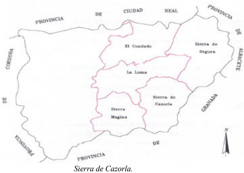
Figura 1. Situación geográfica de las comarcas de El Condado, La Loma, Sierra Mágina, Sierra de Segura y Sierra de Cazorla.

El trabajo se centra en las cinco comarcas más orientales de la provincia, donde se combinan regiones olivareras por excelencia (La Loma y Sierra Mágina), áreas muy deprimidas (El Condado) y zonas montañosas donde la presencia de un parque natural condiciona el desarrollo y las prácticas de cultivo en el olivar (Sierra de Cazorla y Sierra de Segura).