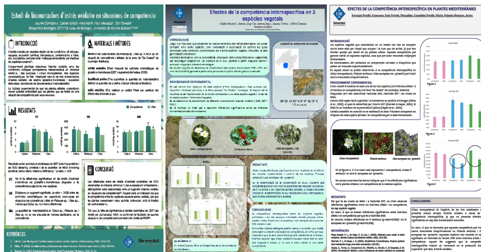
Figura 2. Ejemplo representativo de tres de los pósteres presentados por los alumnos con los resultados obtenidos en las prácticas.

Como valor añadido, el proceso de trabajo en grupos medianos ha permitido obtener resultados muy interesantes sobre los efectos de las interacciones entre especies vegetales.