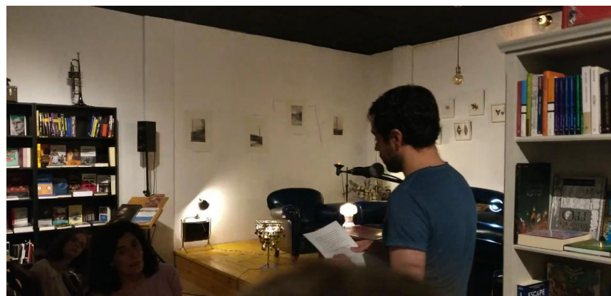
Figura 7. Cartel y folleto de la exposición en La Lumbre. Diseño Gema Pastor Andrés. Figura 8. Detalle de la acción interactiva en la librería La Lumbre el 29 de septiembre de 2018.

El silencio y la oscuridad quedan atenuados por este aprendizaje colaborativo y este juego psicodélico (que enciende y apaga las lámparas). La reapropiación de la palabra en cada sitio, en cada texto, en la voz de cada persona que hace suya, nos habla de una nueva identidad construida en la suma de las palabras, la voz y la luz. El encuentro de las personas con los textos de las mujeres genera nuevas formas de sentir esas palabras: el cuerpo se apropia de la palabra, da vida a la luz y activa la escucha de los otros.