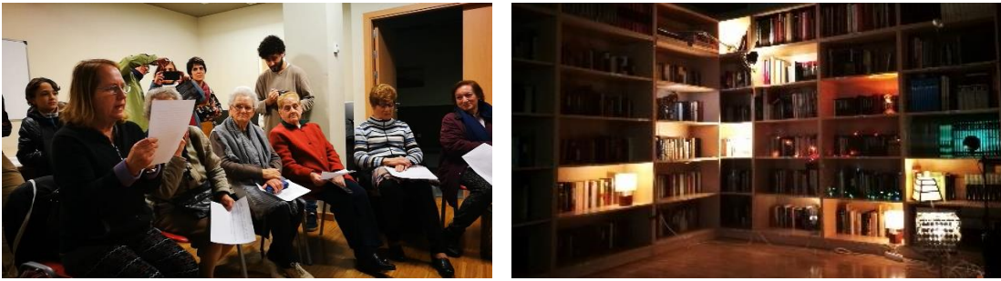
Figura 7. Lectura interactiva en la biblioteca del EMMA. Figura 8. Las lámparas entre los libros de la biblioteca vibrando al son de las palabras el 17 de enero de 2018.

Hay una verdad profunda en esa voz, en ese tiempo de lectura compartido y en esa escucha con los otros [Fig. 7, 8, 9 y 10]. Como dice Meredith Monk “la voz es como una herramienta de descubrimiento, activación, recuerdo, demostración de la conciencia preológica primigenia; la voz es como un significado que viene, retrata, corporeiza, encarna otro espíritu; la voz es como una conexión directa a las emociones, el espectro completo de la emoción, sentimientos para los que no tenemos palabras...” (1997: 55). La luz surge como un elemento de significación donde lo reflexivo y lo profundo se mezclan con lo inmediato y sensorial de la acción. Es un espectáculo donde lo poético, lo efímero, se teje con la acción, con la voz de las mujeres, con la identidad femenina de antes y ahora.