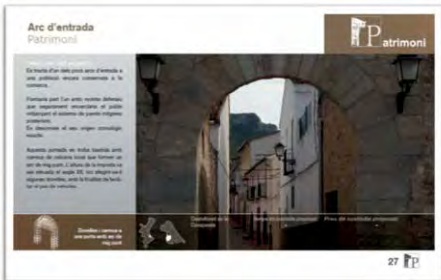
Figura 5. Exemple de fitxa d'un dels projectes que integren el Catàleg de Projectes de Custòdia de l'Ecomuseu Vernissa Viu.

nostre Catàleg de Custòdia del Territori. Aquest catàleg és un llibre on estan ordenats per àrees i descrits els nostres projectes. Alguns ja estan en marxa, altres resten a l'espera, però tots conformen les branques d'un nou model territorial. Cada projecte, al nostre llibre de projectes, està format per una fitxa descriptiva on s'hi inclou la ubicació en un plànol, l'explicació de l'actuació proposada, la quantia econòmica necessària per tal de tirar endavant la iniciativa i diverses fotografies.