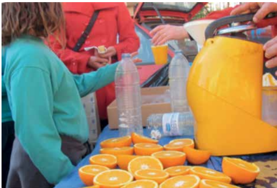
Fotografia 6. Suc ecològic popular de la plantada d'arbres del programa Arbres a l'Aula de l'Ajuntament de Gandia.

De la mateixa forma la participació de l'Ecomuseu en fires, trobades i projectes d'educació ambiental en molts casos innovadors com ara «Arbres a l'Aula» del Departament d'Educació de l'Ajuntament de Gandia (suc popular per a 700 xiquets i xiquetes) o la col·laboració continuada amb Avinença (la Xarxa de Custòdia del Territori del País Valencià), fan possible que es puguin oferir els productes o subproductes (taronjades, tastets, visites...) resultat dels contractes agraris de custòdia.