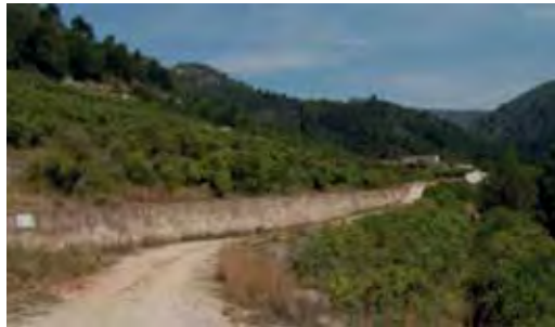
Figura 3. Recorregut i distribució dels conreus històrics del País Valencià a la finca del Racó del Pi.