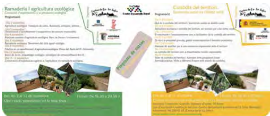
Figura 4. Exemple de programació de dos dels cursos que s'han realitzat a l'FP La Safor a través de la col·laboració amb el CDR.

Aquesta relació ha donat peu a què diferents alumnes en pràctiques del Centre de Formació Professional La Safor hagen estat col·laborant a mode de pràctiques amb el nostre model de territori. Les tasques que han realitzat aquests alumnes han sigut des d'inventaris d'elements naturals, a inventaris dels jardins de la vall, com actualitzacions de la viquipèdia de l'Ecomuseu (mapa de la comunitat) o el suport a la professional que està restaurant una pedrera abandonada a Castellonet de la Conquesta, entre d'altres. Tot això ha tingut un seguiment en el Quadern de l'Ecomuseu . ( www.vernissaviu.wordpress.com ), un blog que conta el dia a dia de l'activitat de l'EVV.