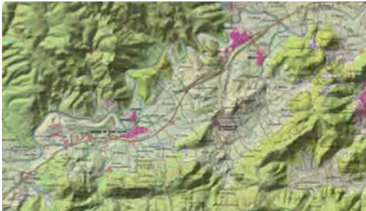
Plànol 1. Marc territorial de l'Ecomuseu Vernissa Viu. La vall del Vernissa, cinc pobles, Llocnou de Sant Jeroni, Almisera, Castellonet de la Conquesta, Alfauir i Ròtova.