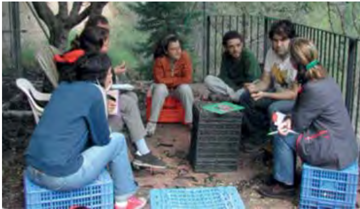
Fotografia 4. Signatura del Contracte Agrari de Custòdia a la finca del Racó del Pi, entre la propietària, l'associació Nerolí i l'Ecomuseu Vernissa Viu. Un acord que va estar en funcionament des de 2007 fins a 2010. Una experiència pionera i que va generar molta activitat al voltant del nou model agrari de la vall.

agrícola. Mitjançant la Borsa de Propietaris amb Cura de la Terra hem acordat els CAC verbals o per escrit. Aquesta borsa de propietaris/àries és el conjunt de terres i de persones amb les quals treballa l'Ecomuseu Vernissa Viu i sobre les quals aplica els programes relatius a la terra i el seu model alternatiu de territori. Com s'ha dit adés, aquest tipus d'acord està actualment en marxa a 8 finques de les quals 6 són agrícoles i aquestes suposen un total de 4,69 ha, o el que és igual 46.907 m 2 .