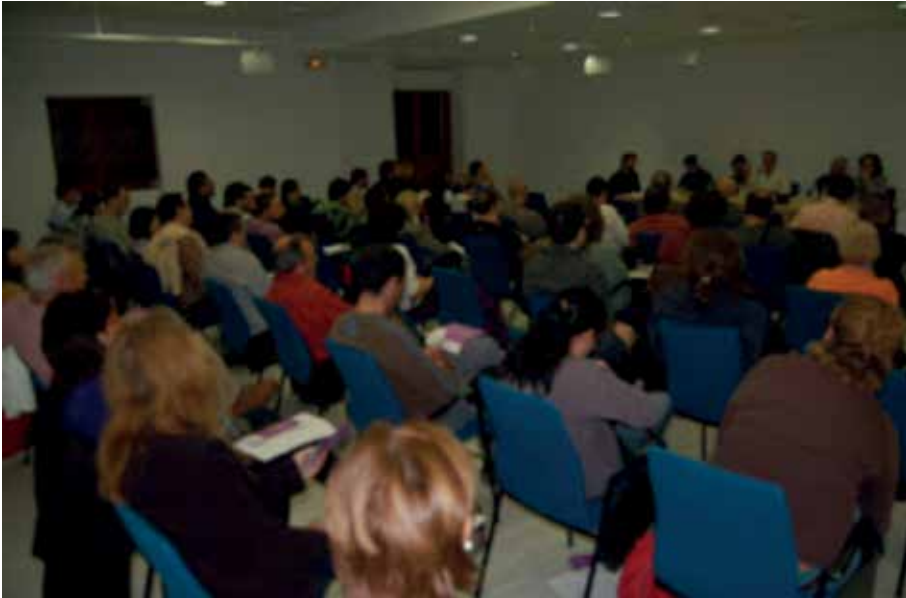
Fotografia 1. Novembre de 2009. Xerrada «Del bancal al plat», sobre consum local a la Safor, dins del marc de les xerrades organitzades per la Plataforma pels Pobles de la Safor. Durant aquests últims 7 anys hi ha hagut multitud de ponències referides al consum responsable a la Safor.

hem anat ajudant a nàixer o hem anat coneixent i contemplant. Al nostre ecomuseu aquest treball està donant resultats esperançadors, dignes i humans, s'han generat experiències que poden ser aprofitades i que han ajudat a generar moviments a la resta de la Safor, de la mateixa forma que l'Ecomuseu Vernissa Viu s'ha nodrit d'experiències valencianes, catalanes, balears, andaluses, italianes o castellanes.