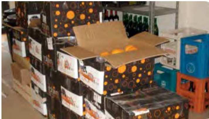
Fotografia 3. Caixes de taronges de l'Ecomuseu Vernissa Viu amb l'etiquetatge propi (marca de qualitat). Producte que prové d'una de les finques amb acord de custòdia.

Aquest segell està pensat com un segell de qualitat a tot tipus de productes, no exclusivament agrícoles sinó també artesans, turístics, patrimonials, de relacions o industrials. Ara per ara, fem aquesta marca per a productes agrícoles i turístics.