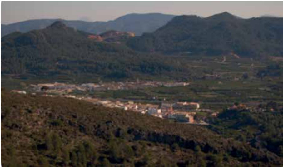
Fotografia 2. Ròtova i Alfauir, una pedrera sobre un castell musulmà del segle X i dos pobles d'interior molt alterats pel nou model d'urbanisme.

El Col·lectiu Vall de Vernissa ( www.valldevernissa.com ) s'havia creat justament per mostrar el valor de tot el contrari, per conèixer i mostrar, alhora, el nostre patrimoni per tal d'ajudar a no malbaratar-lo més. Partint de la realitat, ajudats pels debats i per les ponències de les jornades sobre el territori Josep Camarena (I i II jornades Josep Camarena organitzades pel Col·lectiu Vall de Vernissa), vam teixir una nova possibilitat per la qual anàvem a lluitar, sense pressa però sense pausa. Així vam analitzar l'escenari del nostre entorn immediat: