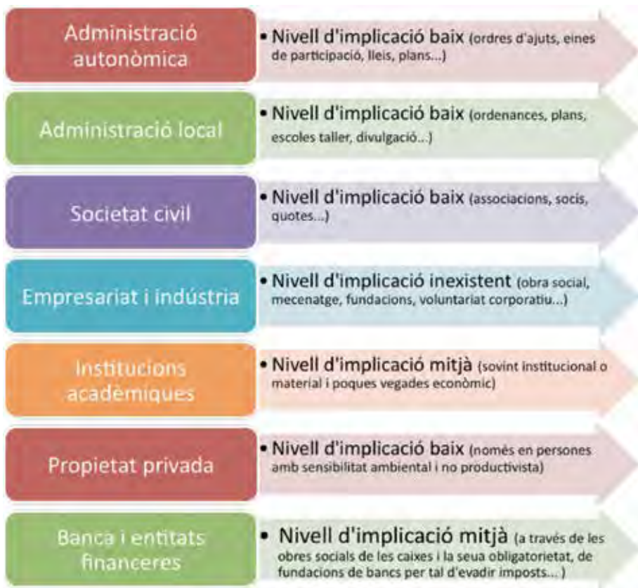
Figura 1. Organigrama d'agents involucrats i del seu grau d'implicació.

Finalment vam analitzar les fonts de finançament des de l'òptica d'una associació civil o d'un/a propietari/ària, anàlisi necessària per posar en marxa el nou model plantejat: