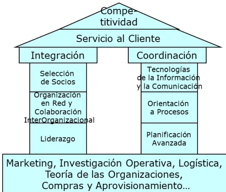
Ilustración 1: La casa de la Gestión de la Casa de la Calidad ((Stadtler, Kilger and Meyr, 2004)

En el nivel operativo se trata de cumplir con los requerimientos de los clientes de la mejor manera posible. En principio la incertidumbre sobre el valor parámetros se tiene que haber eliminado. Otro tipo de incertidumbre aparece: “está o no está”. Las incidencias hacen que el producto o el proveedor no esté disponible y la política de urgencias tendrá un efecto importante en el resultado.