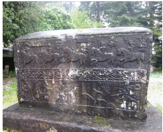
Figura 2. Escenas de caza en un stećak.

como en el caso de una tumba en Donji Olovci donde se puede leer “En el nombre del Padre y del Hijo y del Espíritu Santo, aquí yace Radomir Jurisalić en sus propias tierras nobles”. Junto con esta clase de tumbas, también aparecen otras mucho más sencillas, incluso sin decoración alguna, que parecen hablarnos de los estratos medios y bajos de la sociedad feudal medieval. Como ya ocurriera en el mundo prerromano o romano no todo el mundo era igual ante la muerte. Los más ricos podían permitirse el lujo de pagar una tumba que bien podría ser una obra de arte mientras que los demás debían conformarse con formas y tamaños mucho más modestos, acordes con su condición en vida.