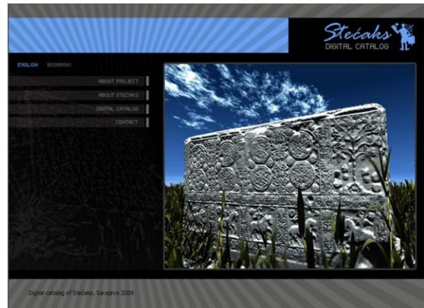
Figura 4. Vista de la interfaz del museo virtual de los Stećci.