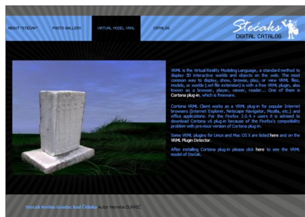
Figura 5. Modelo 3D de un stećka.