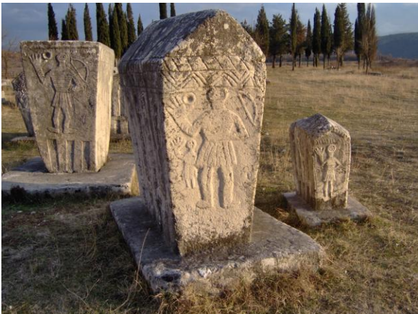
Figura 3. Extrañas figuras de hombres con los brazos en alto.

No menos sorprendente es la coincidencia decorativa entre los Stećci y el arte visigodo y mozárabe español. De hecho muchos de los motivos decorativos de estas tumbas medievales bosnias se pueden encontrar en las principales obras visigodas conservadas en España: racimos de uvas, rosetas hexapétalas, motivos vegetales, roleos, círculos... y arcos de herradura. Aunque generalmente se piensa que este tipo de arcos fueron inventados por los árabes lo cierto es que sus grandes impulsores fueron los visigodos de quienes los copiarían años más tarde los musulmanes tras conquistar la Península Ibérica. La representación de este tipo de arcos en la Bosnia medieval cristiana carece de sentido, lo que no hace sino aumentar si cabe aun más el misterio en torno a estas tumbas.