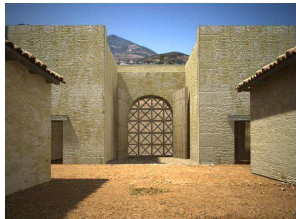
Figura 14. Vista al interior del castellum de la puerta sur en momentos correspondiente a la segunda fase