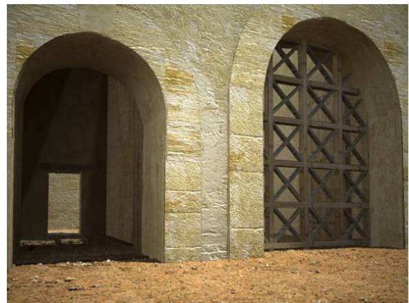
Figura 13. Detalle de uno de los portillo laterales (occidental) de la puerta sur. Al fondo vano de acceso de la torre interior