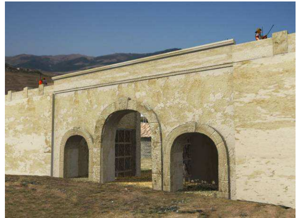
Figura 3. Imagen de la segunda fase constructiva en la puerta este. Obsérvese el cambio en los accesos.

Las últimas fases de la puerta este (V y VI) vendrán representadas por leves modificaciones que apenas afectarán a la fisonomía general de la puerta con lo que no se han elaborado reconstrucciones infográficas correspondientes a dichos momentos correspondientes a momentos tardíos (fines s. IV principios s. V d.C.).