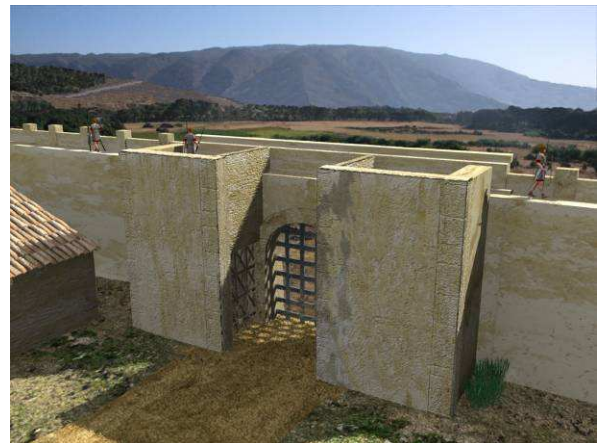
Figura 4. Vista de los cubos interiores desde el interior del campamento.