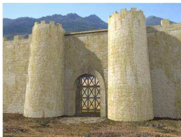
Figura 9. Reconstrucción infográfica con el adosamiento de las torres exteriores.