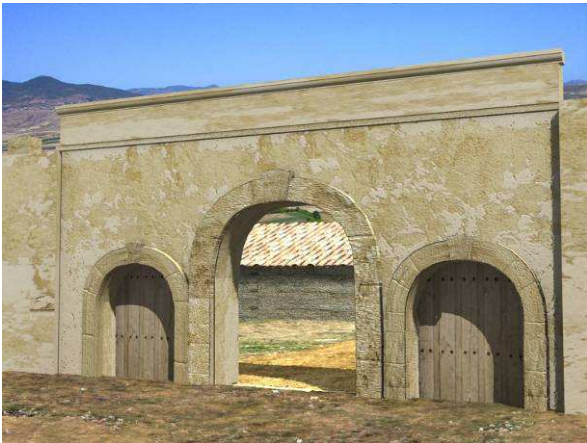
Figura 2. Reconstrucción infográfica de la puerta este. Primera fase.

Bajo la aparente unidad en la fábrica de este conjunto estructural se esconde hasta 5 fases en la evolución del mismo. A este respecto una primera fase vendría representada por un lienzo murado en el que se inserta una obra de cantería representada por los quicios de las jambas. Dicha puerta se configura con un acceso tripartito, con tres vanos, siendo el central mayor que los laterales (Fig. 2).