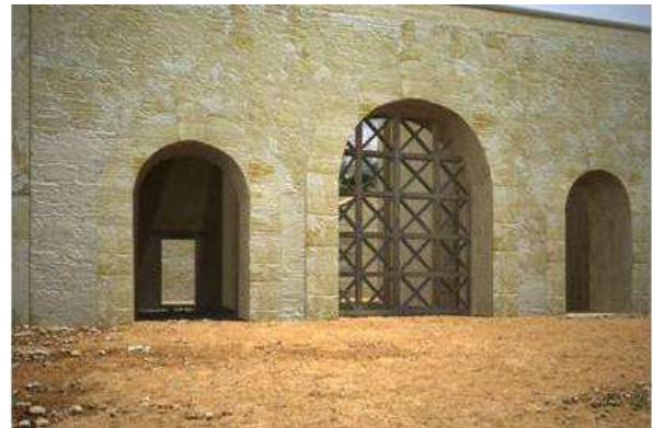
Figura 12. Segunda fase de la puerta sur con el adosamiento de los cubos interiores.

de las torres semicirculares al exterior. Éstas presentarán una sensible diferencia en su fábrica estando la oriental elaborada en opus quadratum y la occidental en incertum revestida de argamasa (Fig. 16).