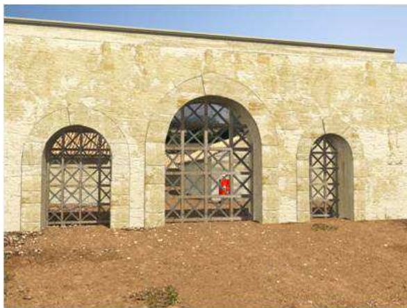
Figura 11. Vista general de la puerta sur en su primera fase constructiva.

En esta línea una de las primeras fases constatadas, para momentos fundacionales fechables en época Julio-Claudia avanzada, viene representada por la construcción de la puerta en una obra de quadratum , como así lo indican los quicios, inserta dentro del lienzo de muralla realizada en un tipo de opus a caballo entre el incertum y el vittatum . De este modo se diseña y construye una puerta con acceso tripartito, con tres vanos de acceso, siendo el central de mayores dimensiones que los laterales, siendo de éstos el occidental mayor que el oriental (Fig. 11).