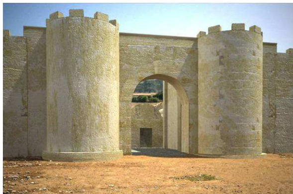
Figura 16. Vista general de la puerta sur a comienzos del s. III d.C., con el adosamiento de las torres exteriores semicirculares.

Tras esta fase se sucederán diversas remodelaciones fechadas en los últimos momentos de vida del campamento. Estas últimas modificaciones en la estructura de la puerta sur verán la apertura de un pequeño portillo lateral en la torre exterior occidental, así como un nuevo recrecimiento del nivel de cota