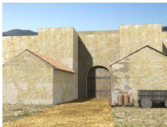
Figura 10. Estructuras adosadas a los cubos interiores para momentos tardíos.