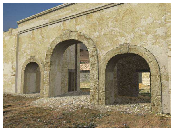
Figura 5. Tercera fase de la puerta este en la que se aprecia el recrecimiento del nivel de suelo y el cambio de vanos en los cubos interiores