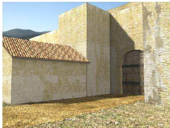
Figura 8. Detalle de la segunda fase con el adosamiento al interior de las torres.

estructuras que complejizarán su planta las cuales aún no tenemos bien constatadas a nivel funcional (Fig. 10).