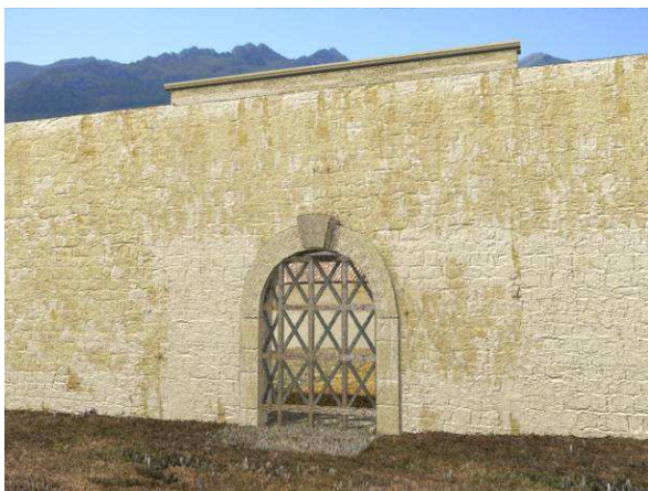
Figura 7. Primera fase constructiva en la puerta norte.

A día de hoy supone uno de los conjuntos estructurales peor conocidos en el contexto campamental dado que aún está a la espera de una excavación arqueológica que venga a aportar nuevos datos a los ya existentes del estudio paramental. Ahora bien ello no ha sido un impedimento para poder plantear diversas fases constructivas. En este sentido una primera fase vendría representada por un lienzo murado simple en el que se abre un vano de acceso elaborado en opus quadratum (Fig. 7).