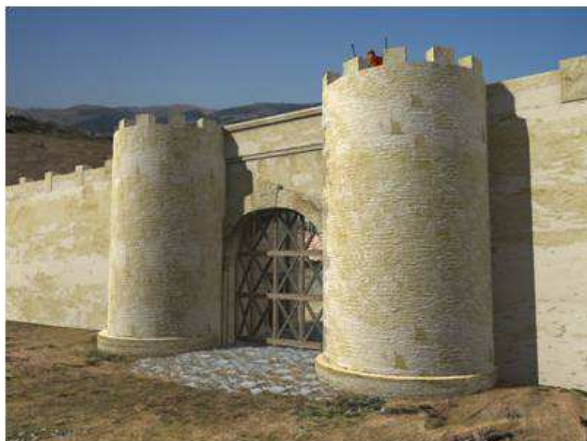
Figura 6. Fase IV detalle del adosamiento de las torres semicirculares y el nuevo pavimento en el acceso.