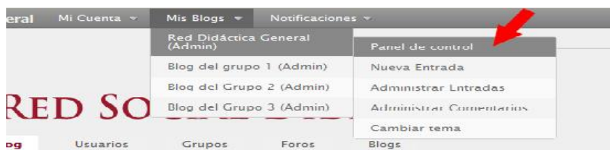
Imagen n.3. Cómo crear un blog en la Red Social Didáctica General

Cada estudiante ha participado, por defecto, del blog principal como suscriptor y del blog asociado a su grupo. Para administrar esta participación hay que entrar en el “Panel de Control” del blog en cuestión. Para ello debemos ir a la barra de menú superior y pinchar en el ítem “Mis Blogs – “Nombre del blog” – Panel de Control” (como se ve en la imagen 3).