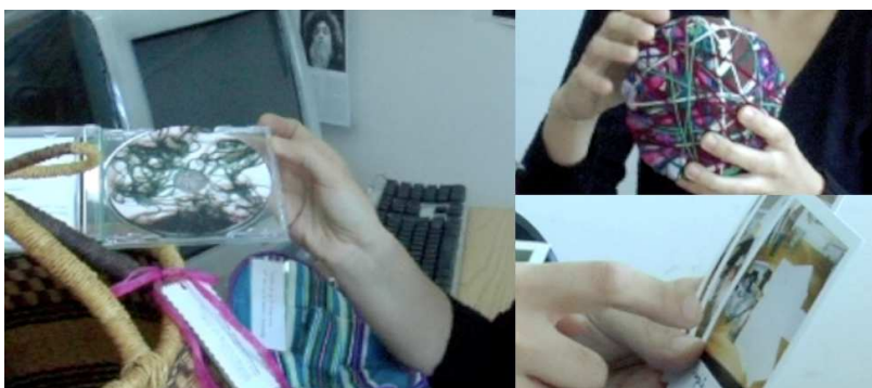
Figura 1.- Imagen de algunos elementos de la carpeta de aprendizaje de Tanit

Las carpetas de ambos estudiantes también son muy distintas. La carpeta de aprendizaje de Tanit contiene objetos personales, vestidos, esculturas, imágenes y textos que ha construido a lo largo de diferentes actividades de la asignatura. El e-portafolio contiene artefactos que se han convertido en evidencias de su aprendizaje mediante la reflexión. Además, en un documento audiovisual que la estudiante incluye en el cesto, se aportan imágenes en movimiento y encabezamientos que narran la reflexión sobre el proceso de aprendizaje y que están ilustrados con una canción de Jorge Drexler que lleva por título “Todo se transforma”.