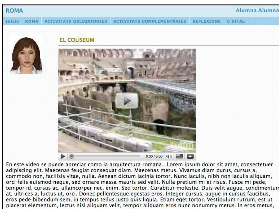
Figura 3. Ejemplo de publicación de portafolios

La Carpeta Digital , como ya hemos comentado, ofrece al alumno un un espacio privado de gestión de portafolios. Al tratarse de una herramienta para la evaluación del aprendizaje, este espacio personal ha de poderse publicar en un momento concreto. En el momento de la publicación, la Carpeta Digital genera una página web correspondiente al portafolios en el que aparecen las diferentes secciones y los distintos archivos asociados.