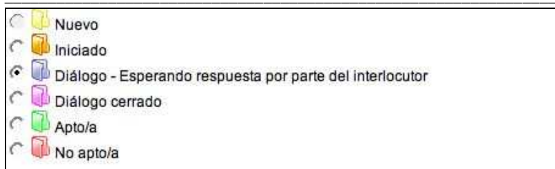
Figura 5. Códigos de colores asociados a los estados del portafolios