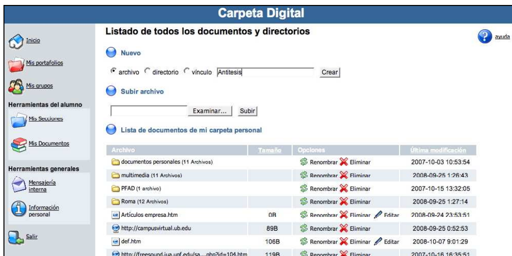
Figura 2. Espacio de “Mis documentos”.

Los documentos son todos aquellos archivos que el alumno guarda para crear su portafolios. Se trata pues de un repositorio de evidencias de aprendizaje que el alumno considera importantes para la organización de su portafolios digital. El sistema permite guardar diversidad de tipologías de archivos: texto, imágenes, audio, video, presentaciones, etc. Existe también la posibilidad de crear documentos desde el propio sistema. En este caso, únicamente se puede generar un archivo en formato HTML mediante el editor propio del sistema, formato por otro lado, altamente recomendable pues como veremos en la publicación, es en el que la Carpeta Digital publica los portafolios de los alumnos.