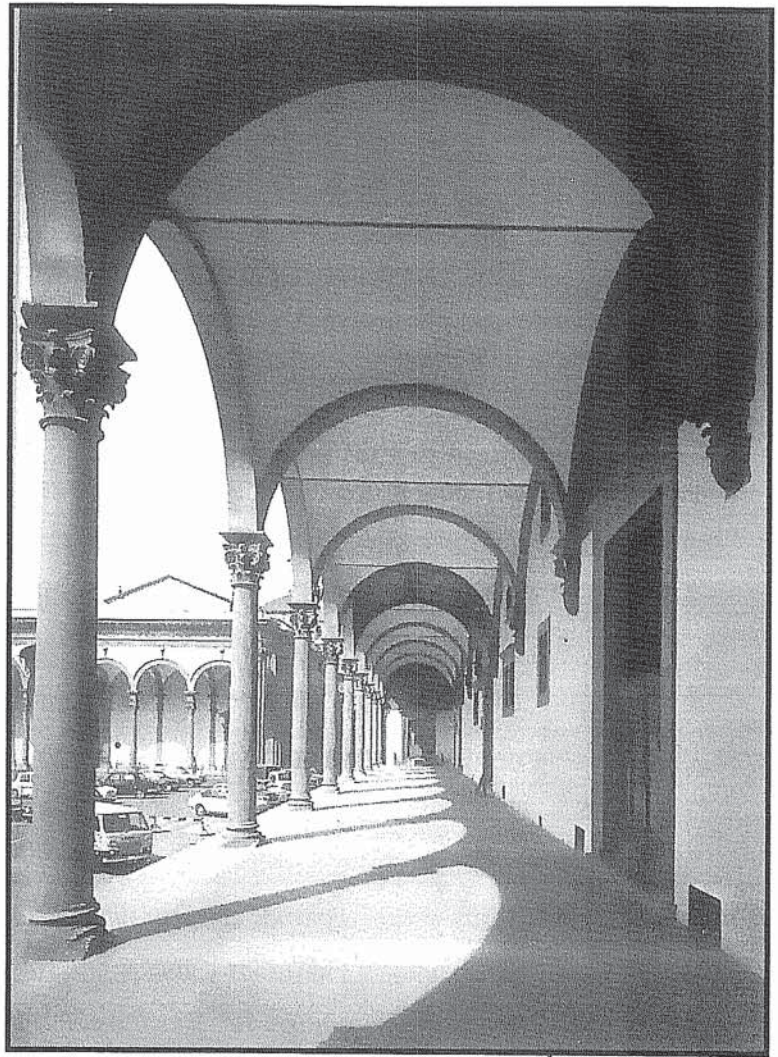
Portico del Hospital de los Inocentes, en Florencia , Brunelleschi 1420. Concebido como una pirámide, con el centro de la base en el ojo del espectador y cuyo vértice constituye el punto de fuga hacia el que convergen todas las líneas.

Este es un somero análisis de tres formas diferentes de reducir la profundidad del espacio al plano , formas que se han desarrollado en diferentes espacios temporales, llegando a convivir en el tiempo. según diferentes concepciones del pensamiento. ♦