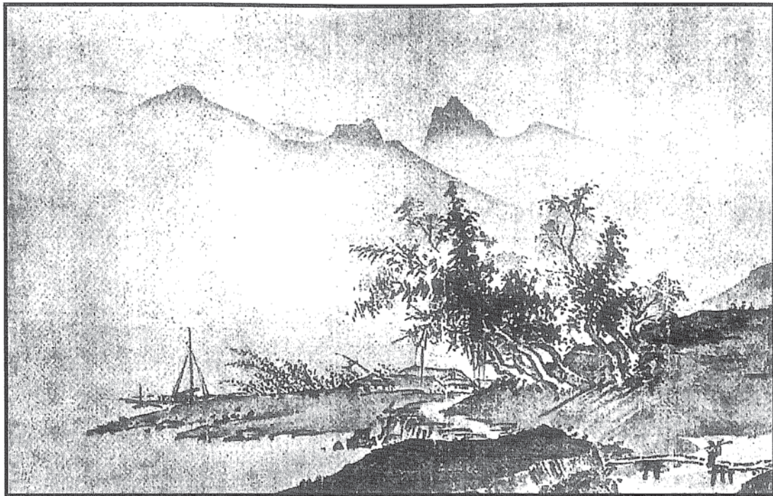
Paisaje, por Hia Kuei (hacia 1180-1234). Colección IWASAKI, TOKIO.

en estos modelos la superficie estaba cuidadosamente evaluada, calculada y dividida según un esquema muy elaborado, impuesto por el dios al que estaba dedicado.