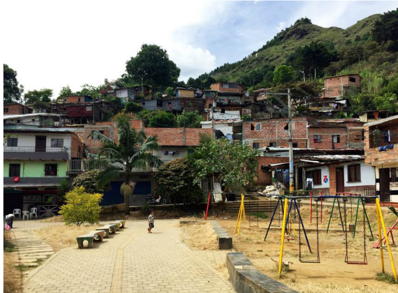
Fig. 6. Imagen del Parque de Pinares de Oriente.

y legalizando sus viviendas y generando proyectos de viviendas nuevas acorde a las necesidades, cultura, arraigo y formas de vida en el territorio.