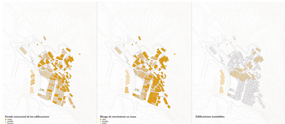
Fig. 3. Estado estructural de las edificaciones, riesgo de movimiento en masa y edificaciones inundables.

la inseguridad legal, la proximidad al Cerro de la comunidad ha permitido establecer un vínculo de retorno al desarrollo rural.