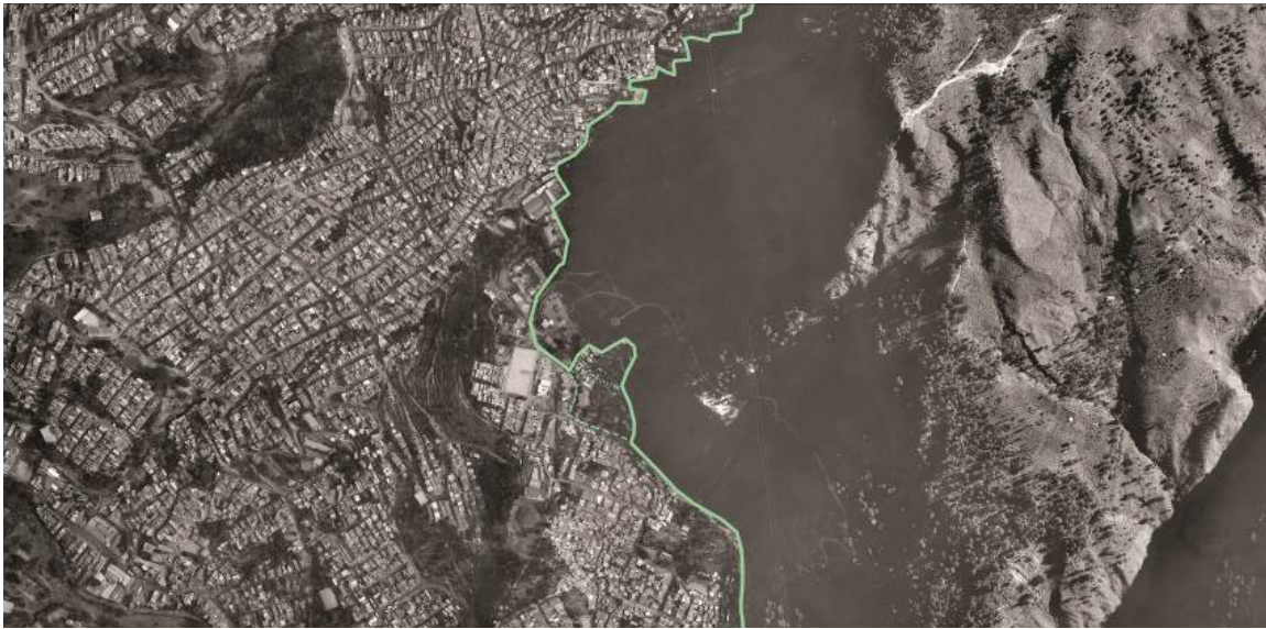
Fig. 4. Imagen aérea de la Comuna 8, límite con la zona no edificada.

relacionen la intervención espacial con las mejoras sociales, culturales y económicas. En vista de la vulnerabilidad de las zonas de acción no es suficiente acondicionar espacios públicos, sino que es necesario prever como estas intervenciones mejoran la seguridad social, económica y alimentaria de su población.