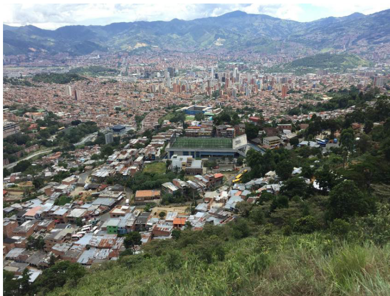
Fig. 1. Imagen desde el Cerro Pan de Azúcar. Al pie del Cerro, Pinares de Oriente, al fondo la ciudad de Medellín en el Valle de Aburrá.

de áreas agrícolas, la ocupación y construcción ilegal de tierras (barrios enteros), y el asentamiento de vivienda en áreas inadecuadas, peligrosas y sin servicios, todo ello con sus consecuentes impacto ambiental y segregación poblacional. Gran parte de las áreas autoconstruidas se localizaron en las laderas de los cerros y las cuencas de las quebradas, y si bien en algunos de estos asentamientos informales se implementaron los servicios y la legalización de los predios, en otros se mantuvo la ilegalidad y la informalidad.