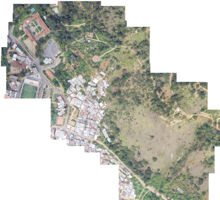
Fig. 5. Imagen aérea de Pinares de Oriente, en el Cerro Pan de Azúcar. Fuente: elaboración propia.

[1] Transformar las condiciones de habitabilidad de las comunidades, mejorando