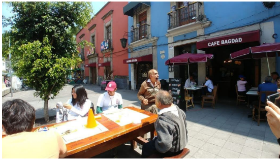
Fig. 1. Trabajo de alumnos del servicio social en plaza Aguilita.

apartados que tratan los siguientes tópicos, el apartado 1 refiere el marco histórico, como fue la llegada de Aztlán de clanes que conformaron Tenochtitlán y la historia de la tierra prometida.