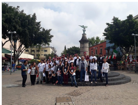
Fig. 3. Fuente con la aguilita de la plaza 2 , representativa de la leyenda del lugar y alumnos de las brigadas del servicio social para el Proyecto “la Técnica al Servicio del Corazón de la Patria”.

En la actualidad el gobierno capitalino colocó 42 piezas de talavera con todos los escudos nacionales que se han usado en la historia. Al centro, se encuentra una fuente adornada con una columna de piedra donde la imagen del águila con la serpiente en el pico