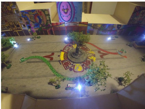
Fig. 8. (arriba) Vista del estado actual de la plaza