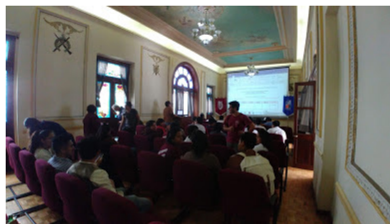
Fig. 5. Concientización del espacio público patrimonial a los alumnos del servicio social de las brigadas en el Proyecto “La Técnica al Servicio del Corazón de la Patria”.

Esta responsabilidad intelectual, Jordi Borja, la aborda desde tres tipos de ejercicio: a) desarrollar una actividad crítica permanente, b) utilizar sus conocimientos para entender y explicar los mecanismos y las contradicciones que generan dichas dinámicas y participar en las reacciones sociales de los que se oponen a estas, c) contribuir a la elaboración de propuestas reformadoras de los mecanismos perversos y generar así culturas alternativas (Montaner 2017:12)