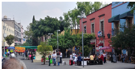
Fig. 4. Trabajos en la Plaza Aguilita, se observa turismo, consumo, y deterioro.

La época actual está inmersa en la globalización, a la cual algunos autores relacionan con lo líquido y con la característica de que se