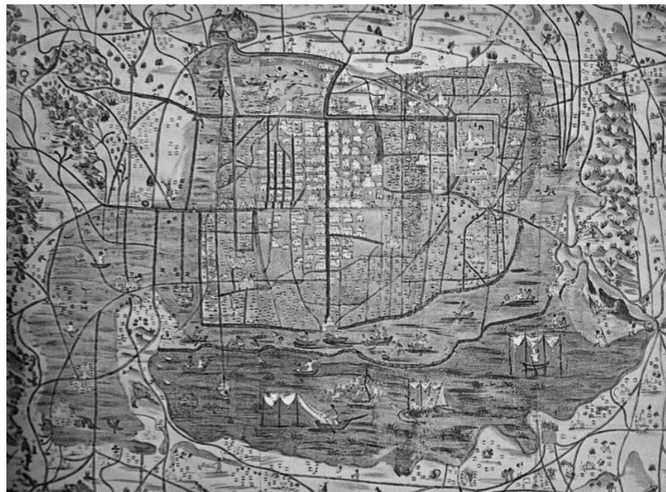
Fig. 2. Plano representando a la Ciudad de México Tenochtitlán alrededor de 1550. 1

La historia del Centro Histórico de la ciudad de México referido a Tenochtitlán y el ombligo de la luna es el lugar fundacional de las megalópolis más grandes del planeta, cuya sede, el Valle de México, es un territorio