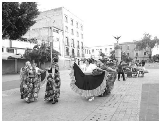
Fig. 6. Plaza "La Aguilita".