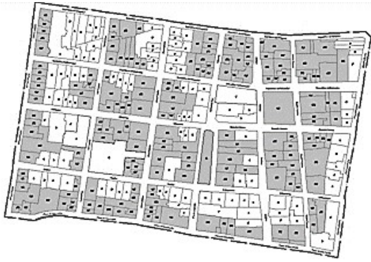
Fig. 7. Inmuebles de uso habitacional (Elaborado por alumnos de topografía de la brigada multidisciplinaria) 5

escolares se ubicaron 2, uno se encuentra en la esquina de la calle de las Cruces y la calle de Mesones y corresponde a una primaria llamada “Escuela Pública República de El Líbano”, el otro está sobre la calle de Regina y es un inmueble propiedad de la Escuela Superior de Ingeniería y Arquitectura (ESIA) unidad Tecamachalco.