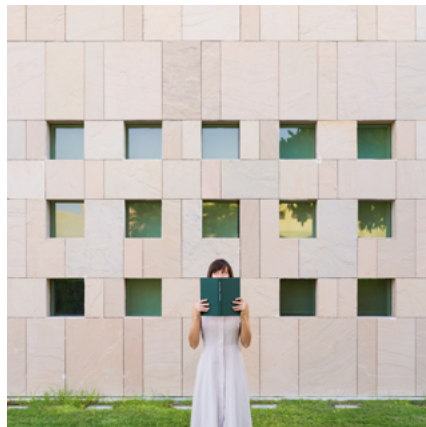
Peek a Book