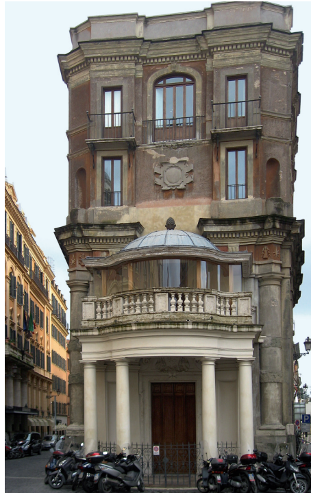
4. Palazzeto Zucari, Roma.