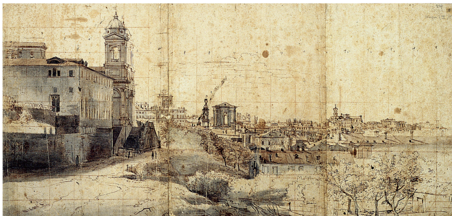
7. G. Vanvitelli, Panoramic view of Rome with Trinità dei Monti , 1681.

more to the right, the campanile and the dome of Sant'Andrea delle Fratte.