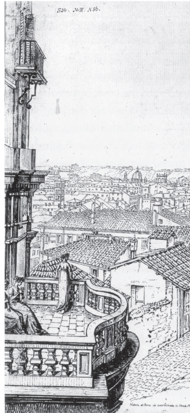
1. K.F. Schinkel, Veduta di Roma da mia Locanda in Monte Pinso presso la Chiesa di St. Trinità del Monte , c.1803-1804.

Keywords: Karl Friedrich Schinkel, Gaspare Vanvitelli, Lieven Cruyl