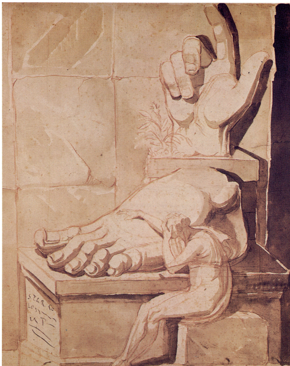
3. H. Fuseli, Artista desesperado ante la grandeza de las ruinas antiguas , c.1778-1780.