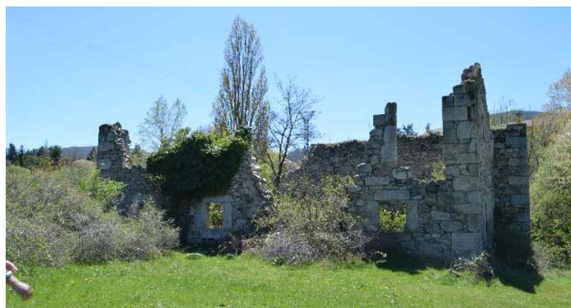
Fig. 2 Molino de mineral del río Gudillos, donde se aprecia su estado de deterioro actual