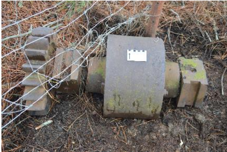
Fig. 3 Piñón metálico del engranaje de un molino de mineral en el km. 33 de la vía férrea

En el cerro de Cabeza Reina se encuentran diseminadas las labores de la mina “El Carmen”, denunciada en el año 1944. La mayoría de labores ya se encontraban realizadas previamente y tan solo se hicieron a mediados del siglo XX, algunos trabajos de ampliación y aprovechamientos ‘de rapiña’. Las labores de mayor importancia de esta mina son las existentes en el km. 33 de la vía férrea Villalba-Segovia (Fig. 1). Actualmente solo se conservan sus escombreras arrasadas por una pista forestal, un piñón de hierro del engranaje de un molino de los años 40 habilitado para machacar el mineral de la mina (Fig. 3) y las ruinas de dos casetas en las que vivían los mineros y se guardaban las herramientas.