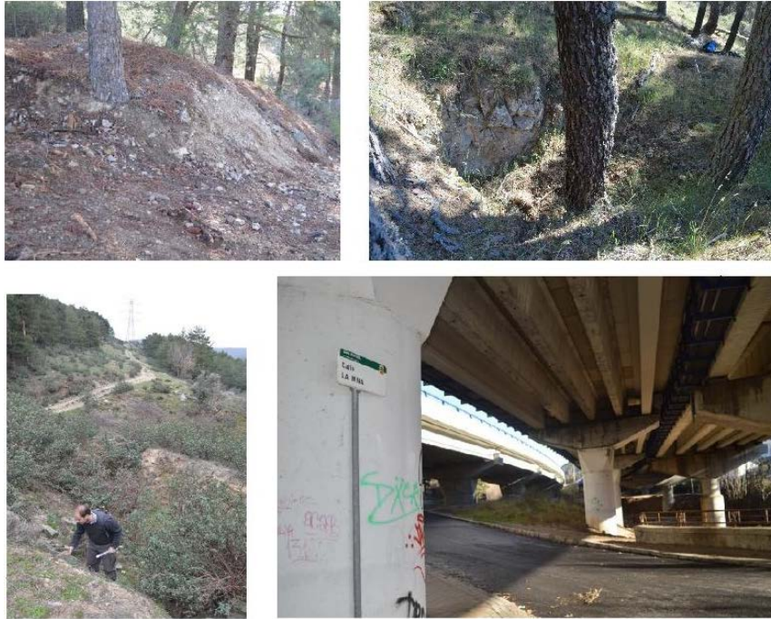
Fig. 6 Arriba a la izquierda, escombreras de las labores de la mina “El Carmen” situadas en el km. 33 afectadas por la apertura de una pista forestal siguiendo la vía férrea. Arriba a la derecha, pozo de la mina “Luis” obstruido por las labores de aterrazamiento. Abajo a la izquierda, aspecto de la “Calicata Santa Rosa” afectada por la apertura del cortafuegos de Cabeza Reina. Y abajo a la izquierda, actual calle La Mina donde se encontraban las labores de “Flor del Espinar”

Tras el abandono de la actividad minera, durante las décadas de 1970 a 1990, se produce la destrucción de gran parte del patrimonio histórico-minero por diferentes motivos, entre los que cabe destacar el trazado de infraestructuras, los procesos urbanísticos y las actividades forestales y ganaderas (Fig. 6).