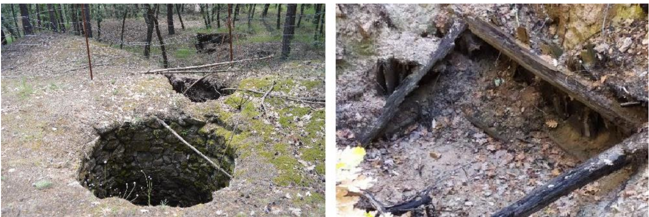
Fig. 4 Izquierda, pozo mampostado de ventilación del pozo Ángel. Derecha, aspecto actual del pozo Ángel. Como se puede observar, a pesar de encontrarse colmatado con tierra hasta su borde, se conserva la antigua entibación de madera. Obsérvese que las galerías que unen los dos pozos están colapsando

El cerro de El Estepar (1346 m.s.n.m) se encuentra al noroeste de San Rafael y al noreste de El Espinar (Fig. 1). En este cerro se pueden encontrar gran cantidad de zanjas y una galería, que constituyen las labores de las minas “Julita” y “Magda”, además de dos pozos (pozo Ángel y su pozo de ventilación) de principios del siglo XX.