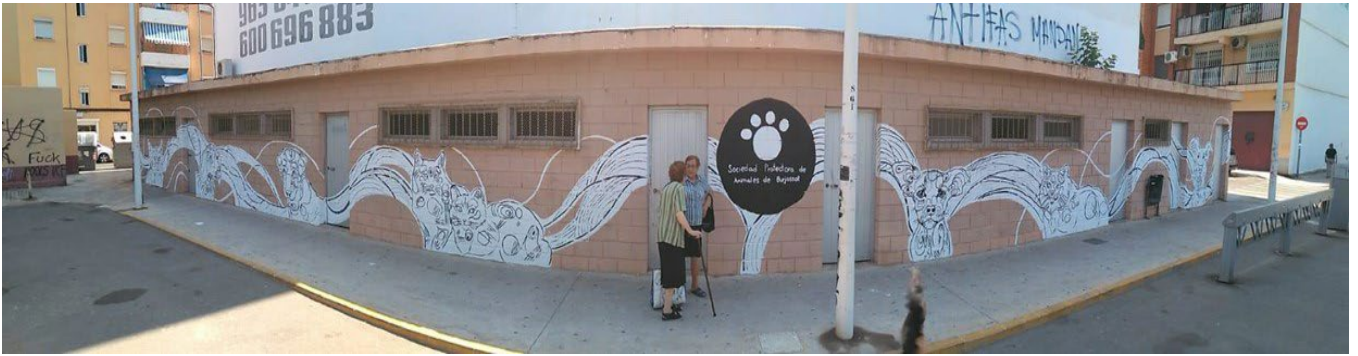
Fig. 7 Baena, D. 2018. Pintura Mural, para dar visibilidad a la protectora de Murales de Burjassot.

de realización de proyecto. Búsqueda de recursos materiales. Registro gráfico del proceso para memoria y exposición oral.