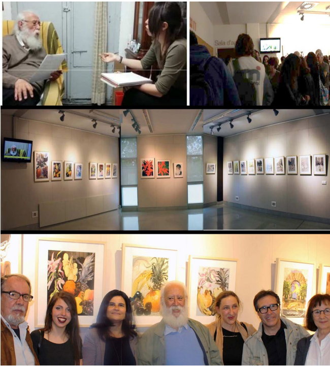
Fig.4 Collage Fotográfico. Puerta, F. 2017. Imágenes de la entrevista para vídeo, montaje expositivo e inauguración. Sala Manuela Ballester. Facultad de Ciencias Sociales. Universidad de Valencia.

Servicio: aprendizaje intergeneracional, ayuda a la realización del montaje expositivo a un autor de reconocido prestigio histórico, de avanzada edad, que desde 2005, no había podido mostrar su obra, pese a seguir produciendo.