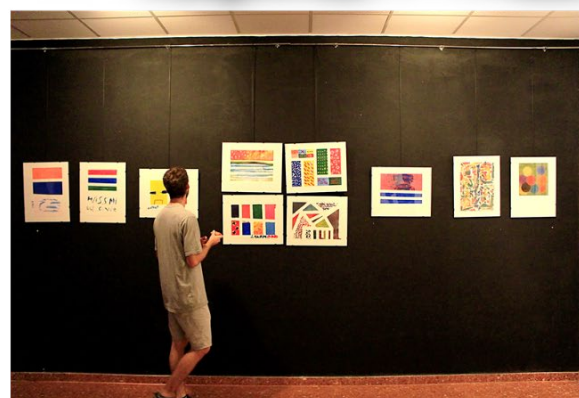
Fig.6 Collage Fotográfico. Puerta, F. 2018. Proceso de trabajo en el Centro Ocupacional y exposición en Espai Llimera. Valencia.