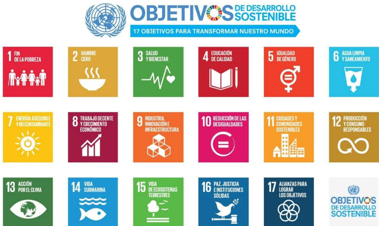
Fig. 1. UN.org. 2015. Síntesis gráfica de los Objetivos de desarrollo sostenible.

ApS , no es sólo una metodología activa y participativa de aprendizaje, es una herramienta