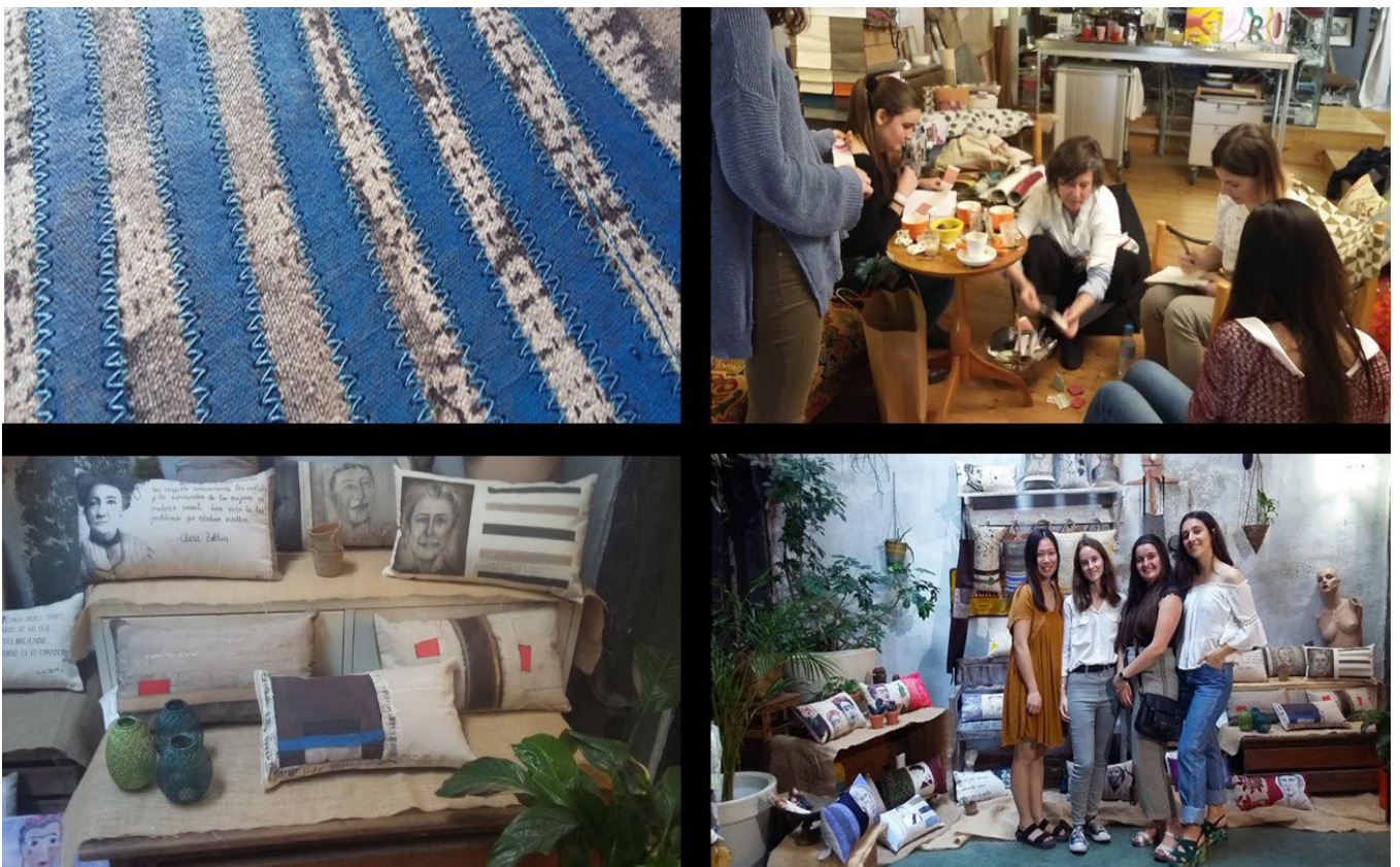
Fig.8 Collage Fotográfico. Puerta, F. 2018. Detalle de producto, proceso de trabajo en el taller, y exposición para la venta en la Boulangerie, Ruzafa. Valencia.

Se realizó una primera fase de ApS de investigación sobre la aplicación gráfica al diseño textil, diversificando la apariencia usual de la marca, para pasar después a una fase de producción, colaborando en la generación de una serie de 30 pillows (de temática de género) y una tercera y última fase de trabajo, que consistió en la planificación de una