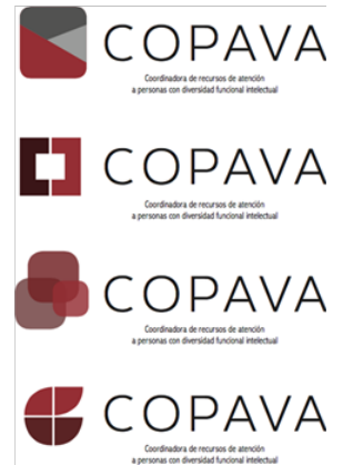
Fig. 5 Collage Fotográfico. Ros, J. y Puerta, F. 2017. Imagen del antiguo logo y de las nuevas propuestas de diseño. Reunión de trabajo, UPV.