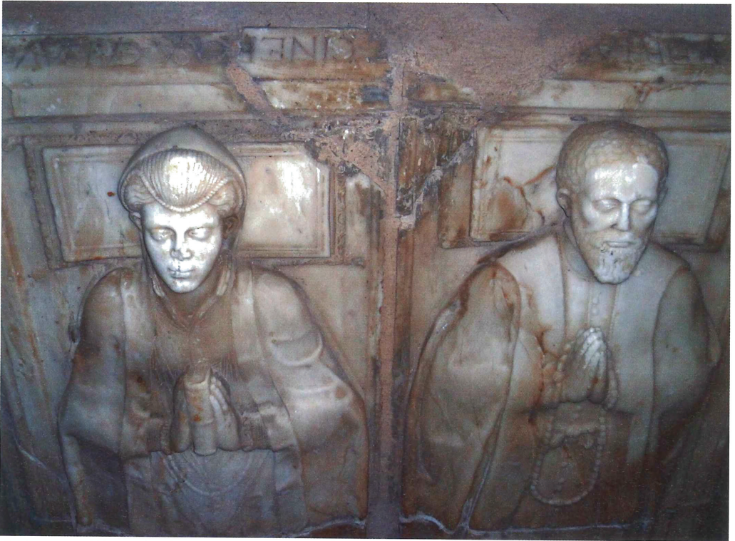
Figura 2.- Vista parcial de les escultures sepulcral en baix relleu de Pedro Gálvez i la seua esposa Ana Velázquez. Río Salido (Guadalajara).