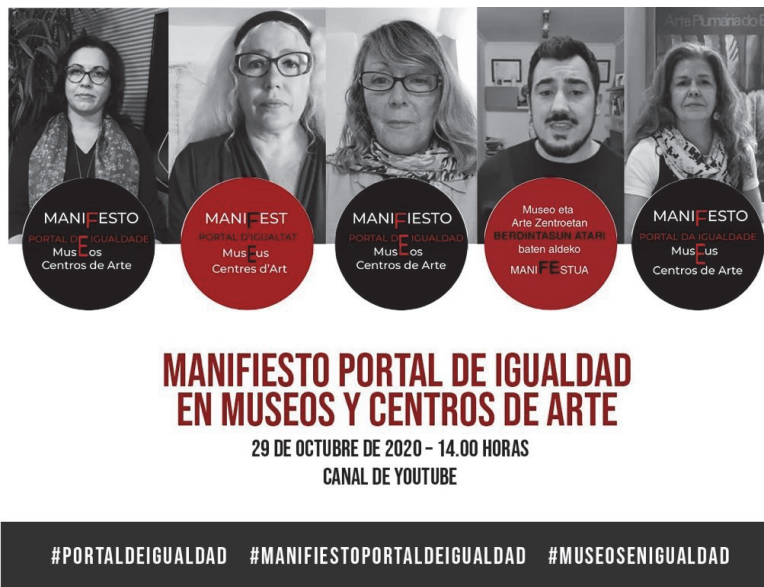
Fig. 5. Cartel del Manifiesto Portal de Igualdad en museos y centros de arte para difusión en RRSS. Correspondiente a la primera acción de la posteriormente consolidada Colectiva Portal de Igualdad, 29 octubre 2020.