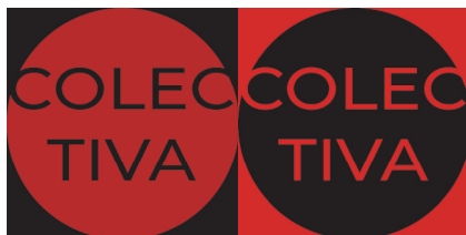
Fig. 8. Fotogramas iniciales del GIF de la Colectiva Portal de Igualdad. Correspondiente a la cuarta acción de la ya consolidada Colectiva Portal de Igualdad, 29 enero 2021

Como cuarta acción, el 29 de enero se ha difundido un GIF 14 ( Graphics Interchange Format ) creada por la artista visual María Penalva-Leal (Alissia) con los colores identificativos del Manifiesto Portal del Igualdad. Como pequeña imagen animada, tiene un efecto de llamada e invita a la interlocución y a ser compartido y difundido. La imagen ha aprovechado la ocasión para presentar ante la opinión pública la Colectiva Portal de Igualdad.