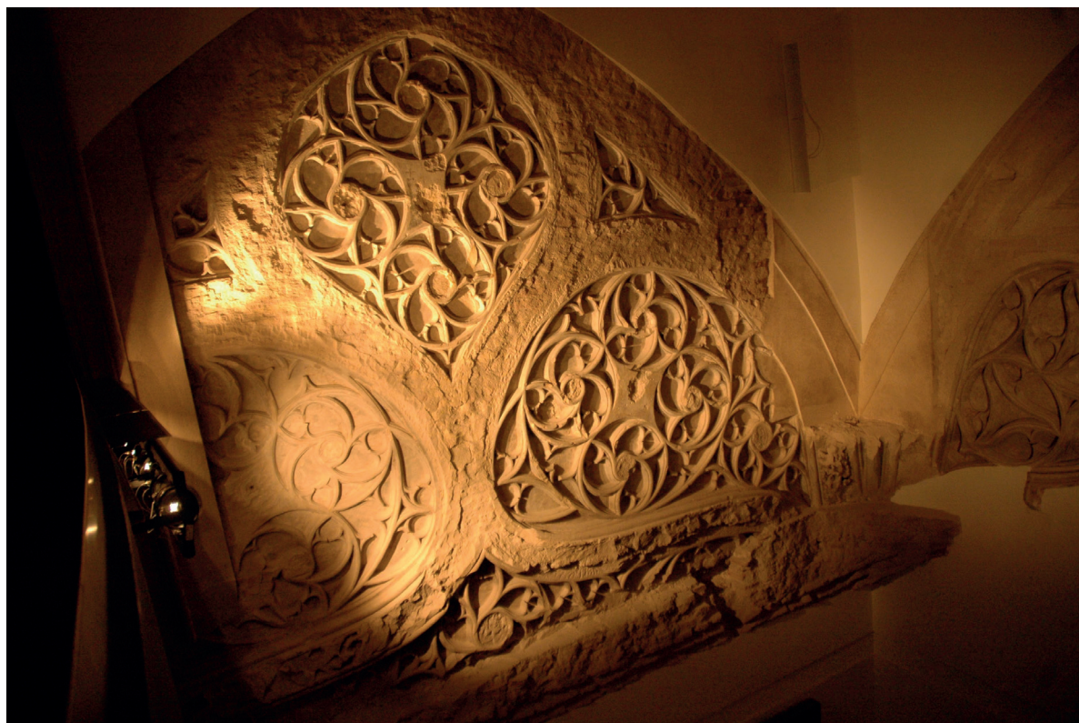
Figura 3. Zaragoza. Palacio arzobispal. Capilla. Decoración de claraboya.

Sus vestigios, felizmente recuperados en el curso de las obras de restauración operadas en el palacio arzobispal hace tan solo unos años, permiten intuir que los responsables de la parroquial bilbilitana pretendieron que el interior del cimborrio de su iglesia pudiera lucir una decoración semejante, realizada en yeso, con arcos a contracurva, formas alveoladas y perfiles sinuosos; un tipo de ornato, propio del Gótico tardío, que aparece descrito en la documentación del periodo como labor de «claraboya», en tanto en cuanto permitía conformar pantallas caladas; de «vesica piscis» o «vejiga de pez», en la medida en que podía recordar a las formas que presentan las membranas que recubren superficialmente los órganos de flotación de los peces; o de «espejuelo», en alusión a