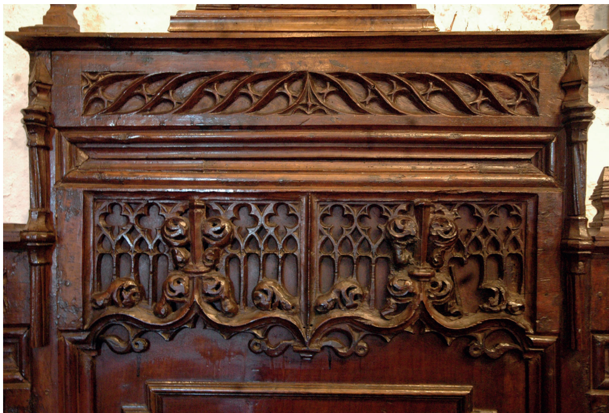
Figura 4. Detalle del respaldo del asiento central de la sedilia confeccionada para la iglesia de San Juan de Vallupié, hoy en la sacristía de la iglesia de San Juan el Real de Calatayud.