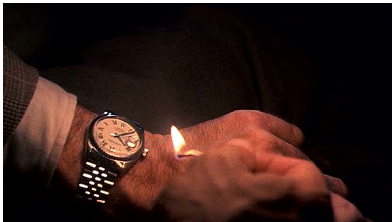
Fig. 2: Christian Marclay, The Clock , 2010. 24 hours, loop. ©Christian Marclay.

espectador consulta su reloj y se levanta para acudir a una cita que la rara experiencia de eso que lleva viendo desde hace ¿cuánto?, ¿dos horas?, ¿tres?, casi lo ha hecho olvidar (Speranza, 2017, 111).