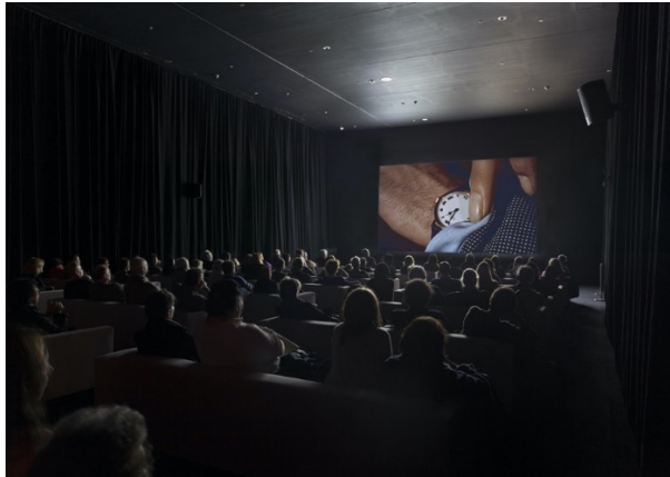
Fig. 3: Christian Marclay, The Clock , 2010. Instalación monocal, 24 horas, loop . ©MoMA

time there. You have to eat, you have to feed your kids or the dog, water the plants... (Myers, 2018).