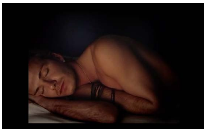
Fig. 5: Sam Taylor-Wood, David, 2004.