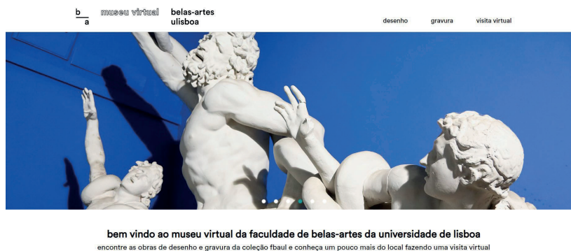
Fig. 1 Web Museo Virtual de la Facultad de Bellas Artes de la Universidad de Lisboa (Portugal)