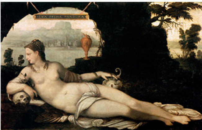
Fig.1 Eva Prima Pandora (Jean Cousin el Viejo, 1550. Museo del Louvre, Paris)

Atendiendo una lógica cíclica, en la actualidad comenzamos de nuevo a reparar en el resurgir del mito de Pandora, en lo que a su perennidad respecta. La identidad de dicha divinidad, a través de una interpretación basada en la esperanza, invita a reflexionar sobre sus nuevas lecturas y acerca de cómo ha atravesado los últimos tres siglos sin agotarse. Precisamente por su ambivalencia, la fatalidad ligada a