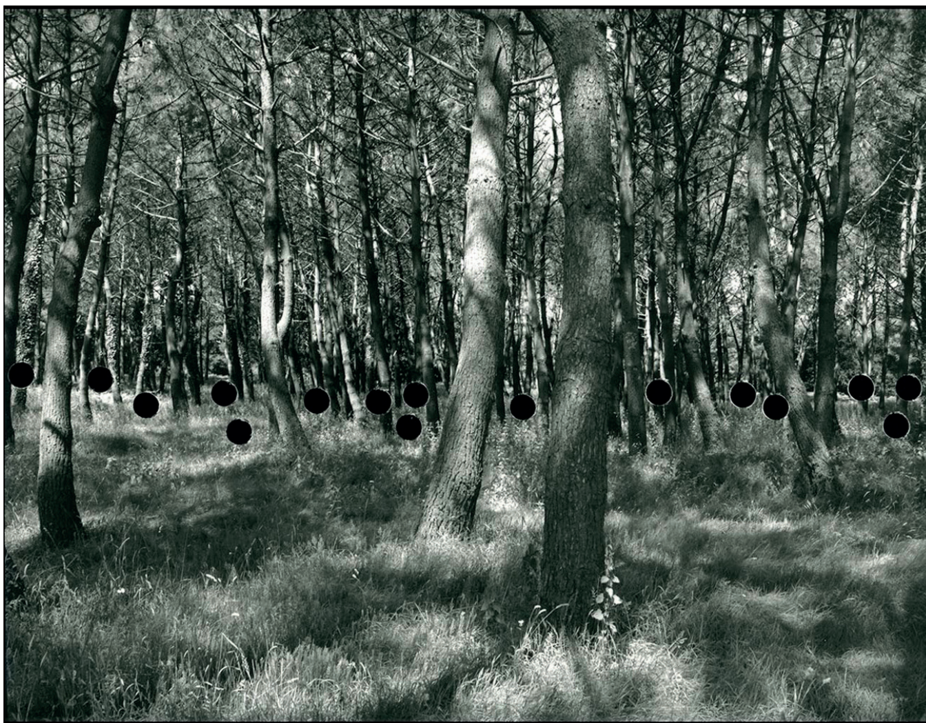
Fig. 1. Aliko Braine (2008). Hunting, Part 3. Impresión Lambda a partir de negativo agujereado. 38 x 48 cm.