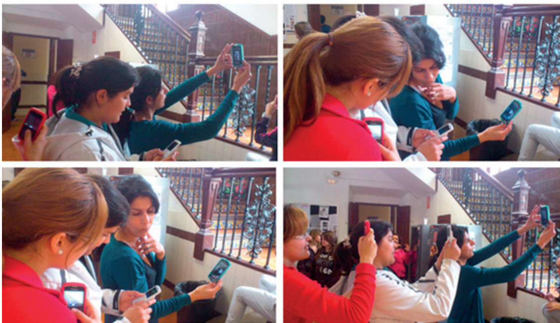
Fig. 1. David Mascarell Palau (2016) Campus d'Ontinyent movilitzados . Serie secuencia organizada con cuatro fotografías digitales del autor (2013).

Con esta intención, se puso en marcha dicha metodología en los dos campus universitarios de la Universitat de València, en la Facultad de Magisterio, donde el autor del presente trabajo imparte docencia. La finalidad fue que los estudiantes experimentaran una acción educativa de reflexión artística mediante las TIC, experiencia que, a su vez, se convertiría en un recurso generalizable a las aulas infantiles, en la futura vida laboral docente.