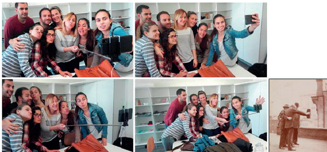
Fig. 2. David Mascarell Palau (2017) Selfies . Fotoensayo Deductivo compuesto por cuatro fotografías digitales del autor (2016) y una Cita Visual Literal (Byron, 1920). 1

En la actualidad, según Gayet, (2018: 199) podemos considerar el selfie como (...) “un autorretrato fotográfico-digital publicado en la red como una práctica contemporánea, que casi con total certeza, será tenida en consideración como uno de los frutos culturales y populares de nuestra época”. Además, el teléfono móvil destaca por aportar múltiples oportunidades al usuario, no solo como instrumento de comunicación, sino también como recurso de expresión social, ocio e información, y siempre con la particularidad de garantizar una elevada dosis de autonomía. Como “instrumento a la carta” que