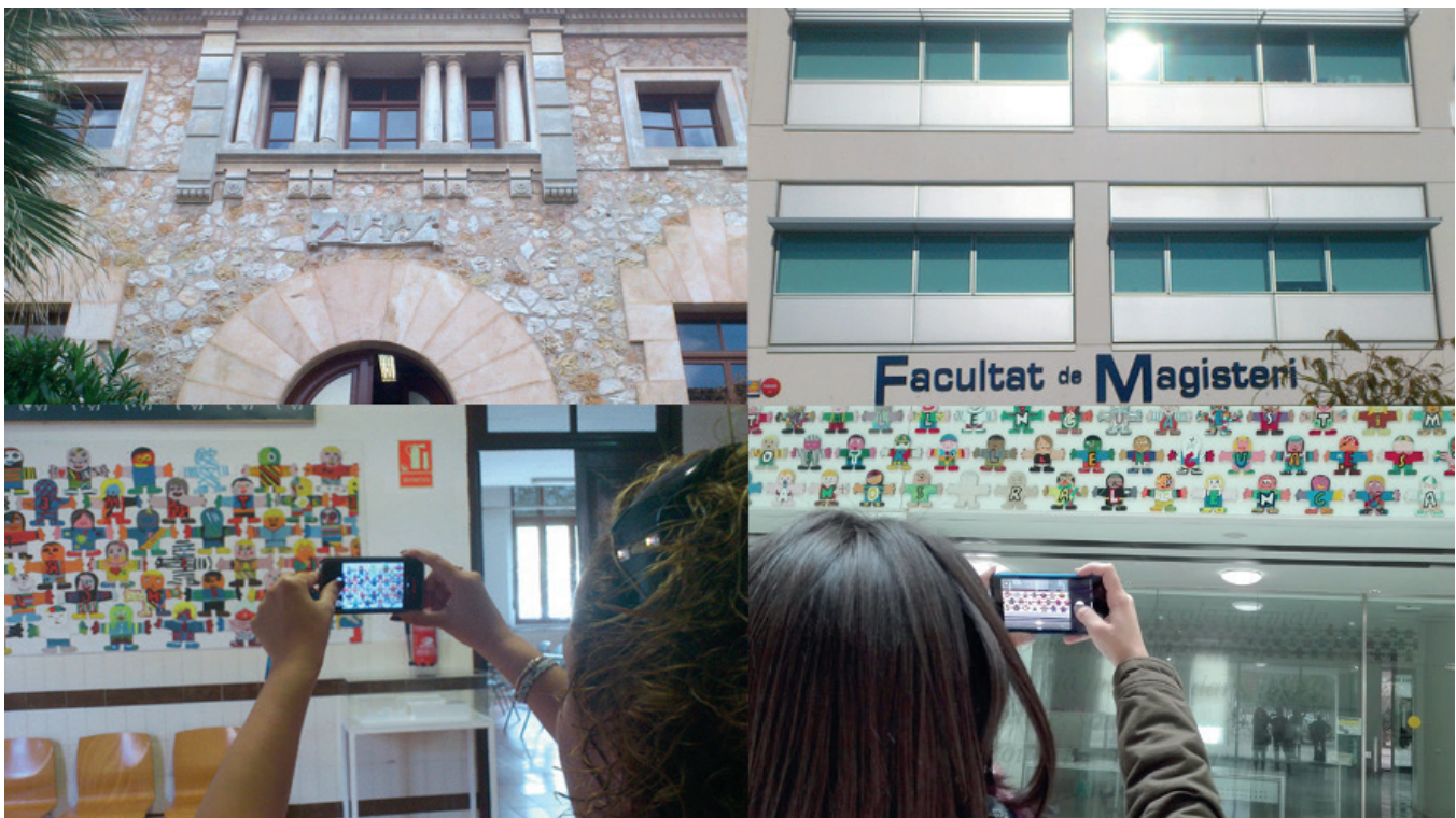
Fig. 5. David Mascarell Palau (2017) Ontinyent-Tarongers . Fotoensayo compuesto por cuatro fotografías digitales en color del autor (2012, 2017).

Paradójicamente, el trabajo compositivo de narración visual de la Fig. 5, destaca un mural que tienen en común las dos Facultades de Magisterio y que las unifica visualmente bajo el mismo criterio gráfico. Se trata de un mural dirigido por el diseñador valenciano, Javier Mariscal, conocido por ser el creador de "Cobi", el perro de estilo cubista que sirvió de mascota para los Juegos Olímpicos de Barcelona 1992. Mariscal realizó para la Escola Valenciana el mural "Estimem la nostra llengua", cuya traducción es "Amemos nuestra lengua", en referencia a la lengua de la región valenciana. Está compuesto por 518 muñecos, popularmente denominados "mariscalets", que se diseñaron en las escuelas de las distintas comarcas del País Valenciano, partiendo de un patrón común de base de madera, que era personalizado por cada creador. El resultado está expuesto permanentemente en el hall de entrada de la Facultad de Magisterio del Campus Dels Tarongers de Valencia, mientras que una pequeña parte de los "mariscalets", lo están en