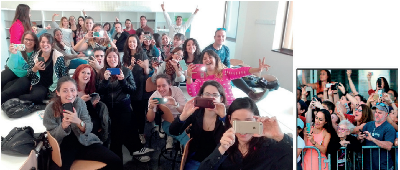
Fig. 4. David Mascarell Palau (2016) Generación digital . Fotoensayo Deductivo compuesto por una fotografía digital del autor (2016) y una Cita Visual Literal de John Blanding (2015). 2

venas donde la actualidad digital ha calado de tal manera que de la interrelación generada han eclosionado múltiples hashtags o denominaciones: «Generación net», «Generación Multipantalla», «Generación Interactiva», «Generación @», «Generación Red», «Generación Multitareas» o la más difundida «Generación Móvil». Buena parte de la investigación social (Levinson, 2004; Cabrera, 2011) vincula el amplio desarrollo del teléfono móvil a los conceptos sociológicos de grupo y de relaciones primarias, a la necesidad de identidad y de comunicación. Esta necesidad construye el entramado social de valores, normas y comportamientos del individuo y del grupo. La hiperconexión virtual en que se vive modifica los esquemas espacio temporales tradicionales de las relaciones sociales. Predomina una situación de ubicuidad versus los contextos físicos y temporales particulares. Estamos asistiendo a un cambio total de escenario. Los nuevos elementos tecnológicos han invadido tanto los contextos públicos como los privados, dando lugar a nuevas posibilidades en las relaciones interpersonales.