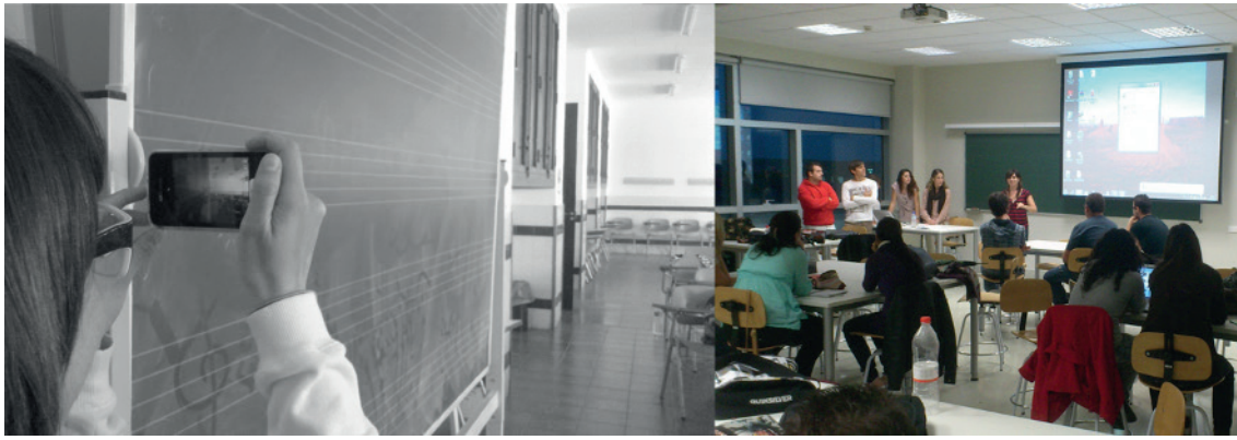
Fig. 7. David Mascarell Palau, (2017) Dos espacios, dos tiempos . Fotoensayo compuesto por una fotografía digital B/N del autor (2012) y una fotografía digital en color del autor (2011).