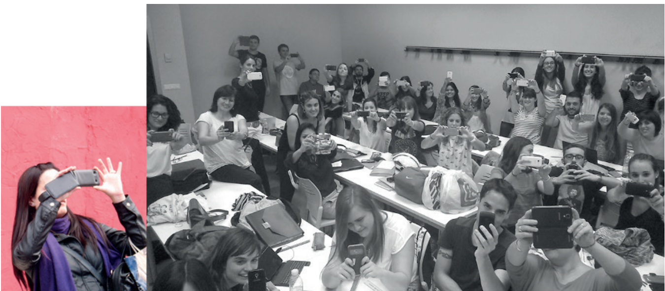
Fig. 3. David Mascarell Palau (2017) Siempre a tu lado . Fotoensayo compuesto por una fotografía digital a color de una alumna del grupo de estudiantes “Els Pasqualos” (2011) y una fotografía digital B/N del autor (2014).

Según Abad y Palacios (2008: 114): «Para los educadores artísticos las ocasiones de aprendizaje artístico no aparecen únicamente en las aulas y museos sino en cualquier situación social». Conectando la significatividad del ámbito social con el pensamiento de Prensky (2011: 11) «uno nuevo mundo virtual (por ejemplo, en línea) ha surgido de la nada y se ha convertido en el foco de atención de muchos de nuestros chicos». Es precisamente este segmento de población que se encuentra en un momento crucial para la formación de la propia identidad, quien hace mayor uso de esta tecnología. Es entre los y las jó-