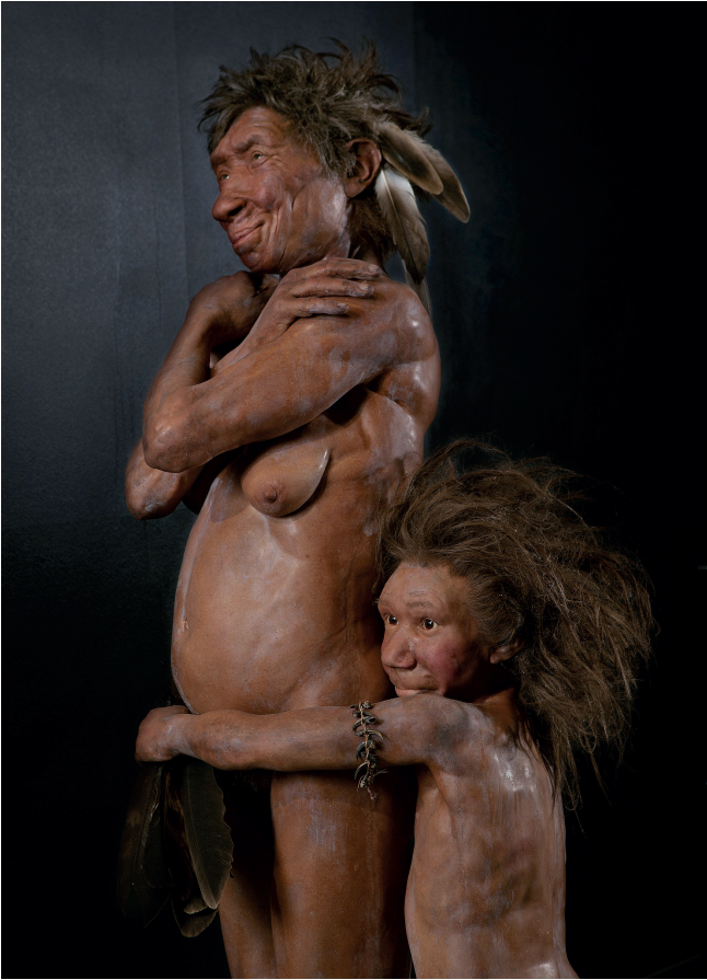
Ilustración 3: Reconstrucción de los Neandertales de Gibraltar, Kennis & Kennis (2016)