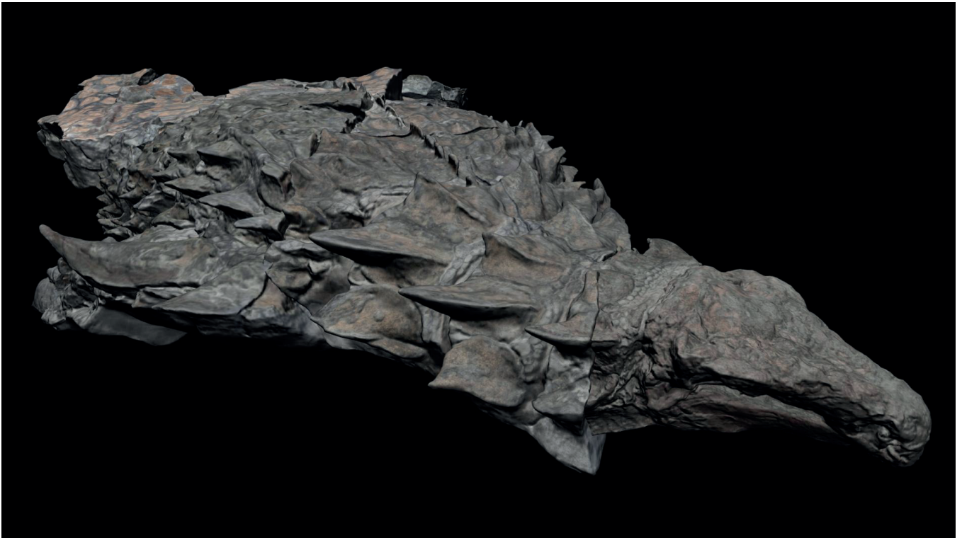
Ilustración 4. Modelo 3D para el artículo de National Geographic “Resurrecting a Dragon” (2017)