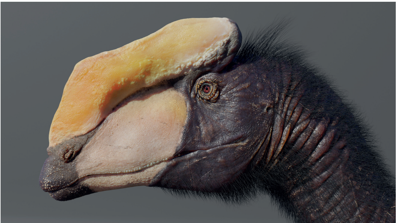
Ilustración 2. “Dilophosaurus Wetherilli”, Joanna Kobierska (2020)

Esta frase denota la dimensión expresiva que aporta el trabajo de los hermanos Kennis; no se limitan a representar una figura esquemática e inánime, sino que van más allá y tratan de recrear la expresión, un gesto, que nos acerca a su reconstrucción y despierta nuestra empatía. Su destreza los hizo merecedores del Lanzendorf en dos ocasiones, y sus piezas son