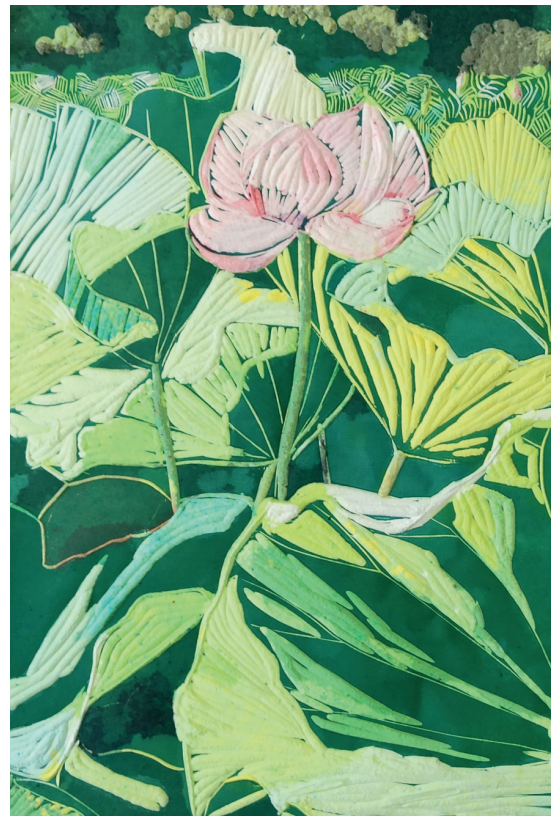
Nymphaea de limbos verdes 2020. Xilografía con pulpa de papel. 600x400mm. Gema Climent.