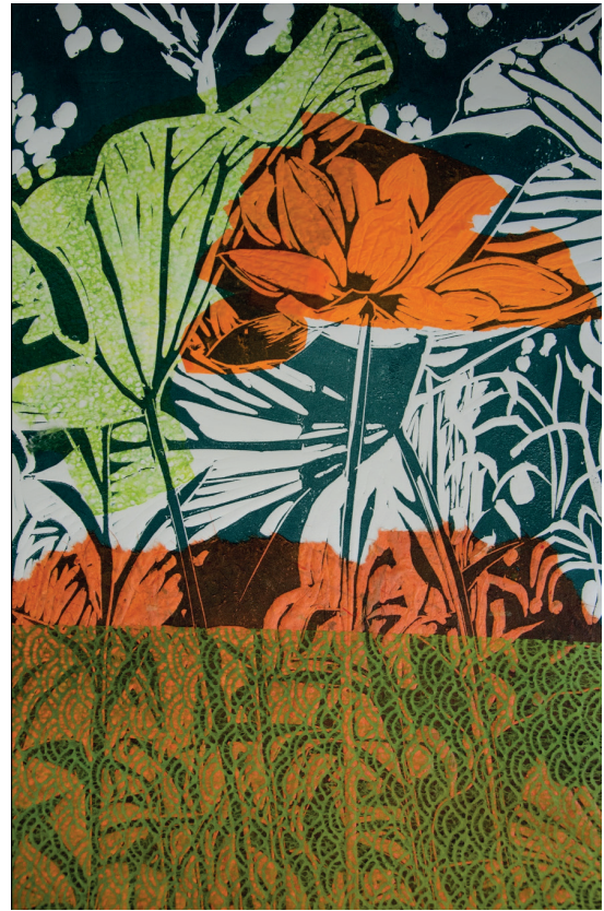
Rizomas entrelazados II. 2020. Xilografía con pulpa de papel. 600x400mm. Gema Climent.