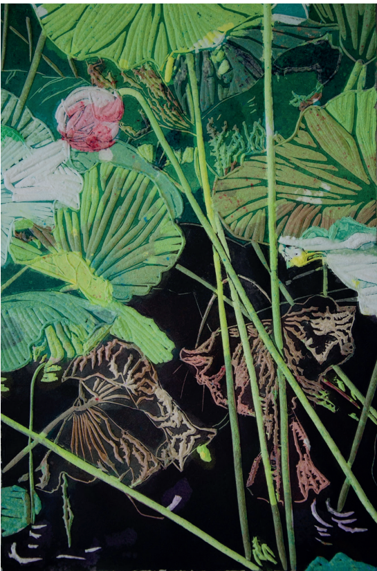
Nymphaea de largos peciolo. 2020. Xilografía con pulpa de papel. 600x400mm. Gema Climent.