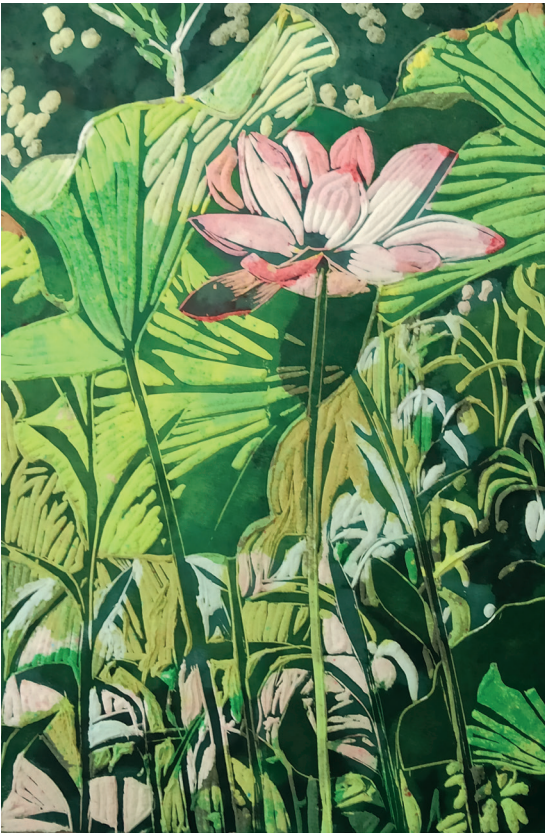
Rizomas entrelazados I. 2020. Xilografía con pulpa de papel. 600x400mm. Gema Climent.