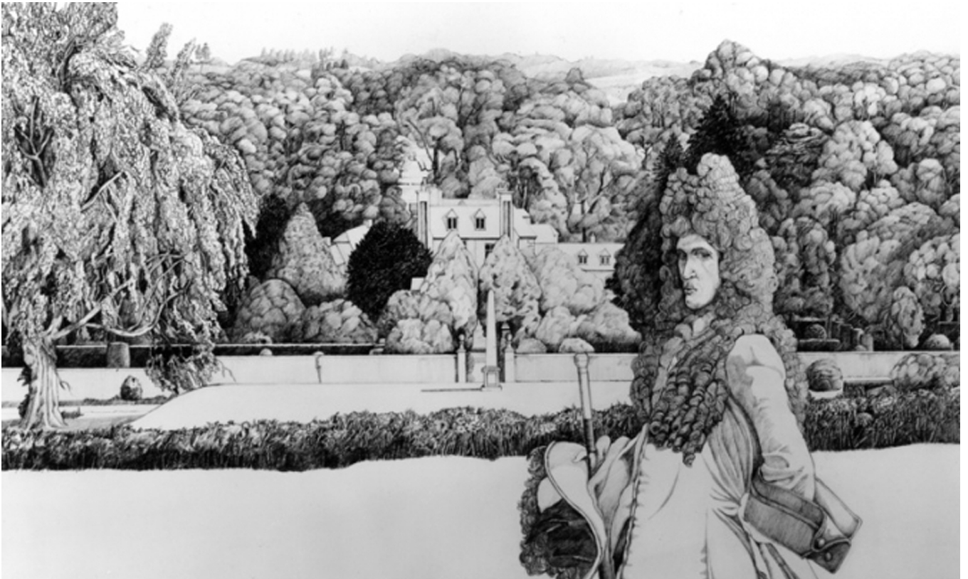
Fig. 1: Peter Greenaway, 1982. Dibujo, 52 x 77 cm.

física en el interior del relato de doce dibujos a plumilla 5 . El film, articulado a partir de esos doce dibujos, tiene la particularidad de buscar la codificación y captura de la naturaleza, mediante procedimientos como la cuadrícula.