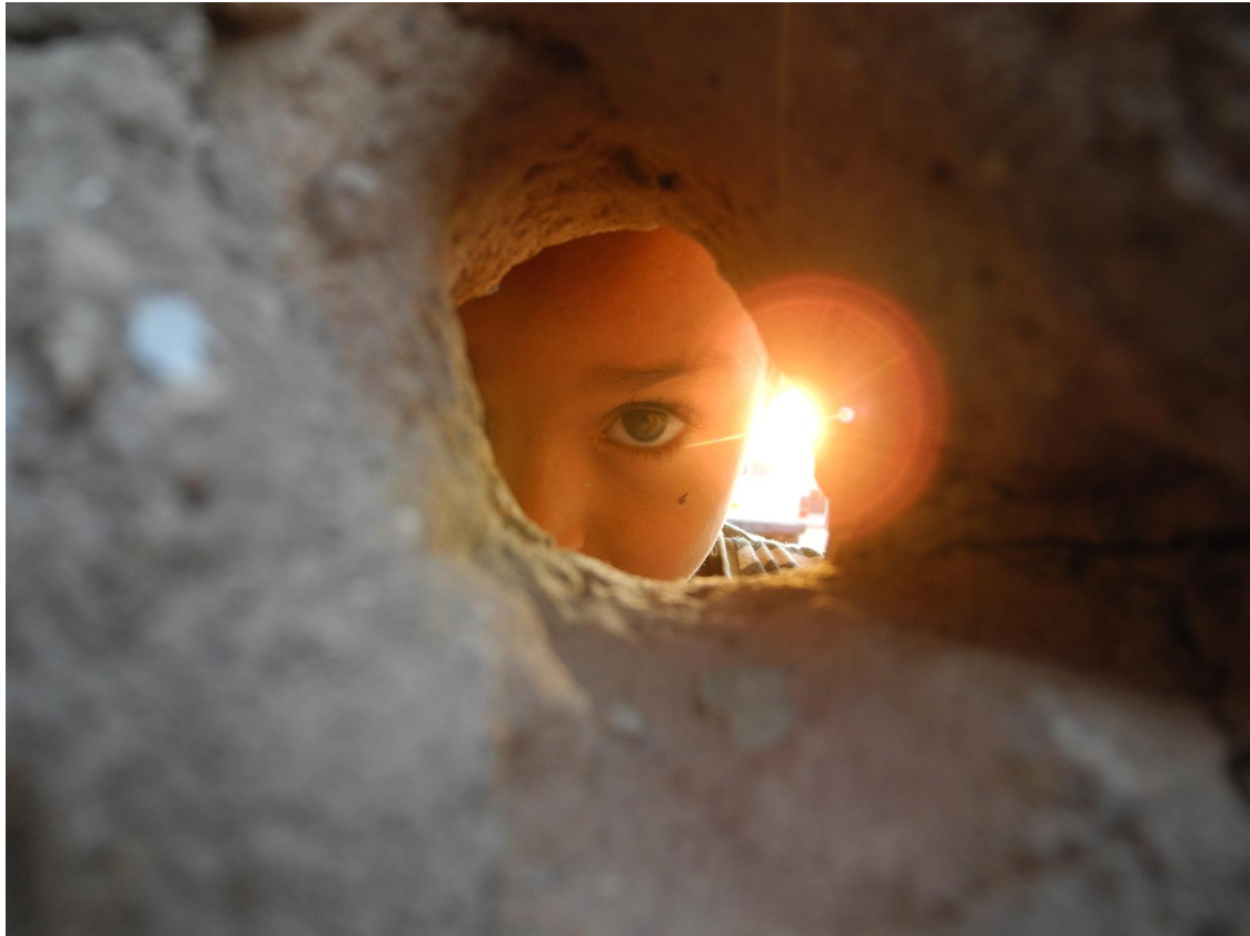
Ilustración 4. Autor. Sadek a través de. Fotografía digital independiente. Campamento de Refugiados Saharais, Tindouf, Argelia, 2011.

Y las de Ricardo Marín Viadel, cuando afirma que la Educación Artística nos permite: