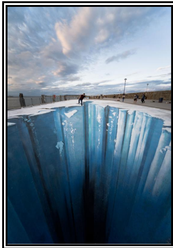
Ilustración 1. Cita Visual Literal. Mueller, Edgar. The Crevasse . Pintura – Instalación. 2008.

Aliance for Art Education (WAAE), National Art Education Association (NAEA) o la Red Iberoamerica de Educación Artística (RIAEA)... A su vez se han realizado diversos informes nacionales e internacionales sobre la importancia de la Educación Artística y la creatividad (algunos de los cuales se citán aquí). Estos avances en el campo teórico de la Educación Artística son absolutamente necesarios si buscamos un mínimo de coherencia en nuestros sistemas educativos. Nos preguntamos sobre la importancia que se le da hoy en día a las asignaturas artísticas (artes plásticas, teatro, música, danza,...). Vemos que existen buenos libros de texto, ambiciosos planes de estudio sobre estas materias y pensamientos lúcidos, pero ¿cómo es la práctica en realidad? Según expresa claramente Anne Bamford en su investigación supranacional encargada por la UNESCO para determinar el estado de la Educación Artística a nivel internacional: “hay un abismo entre lo que se dice y lo que se hace” 6 .