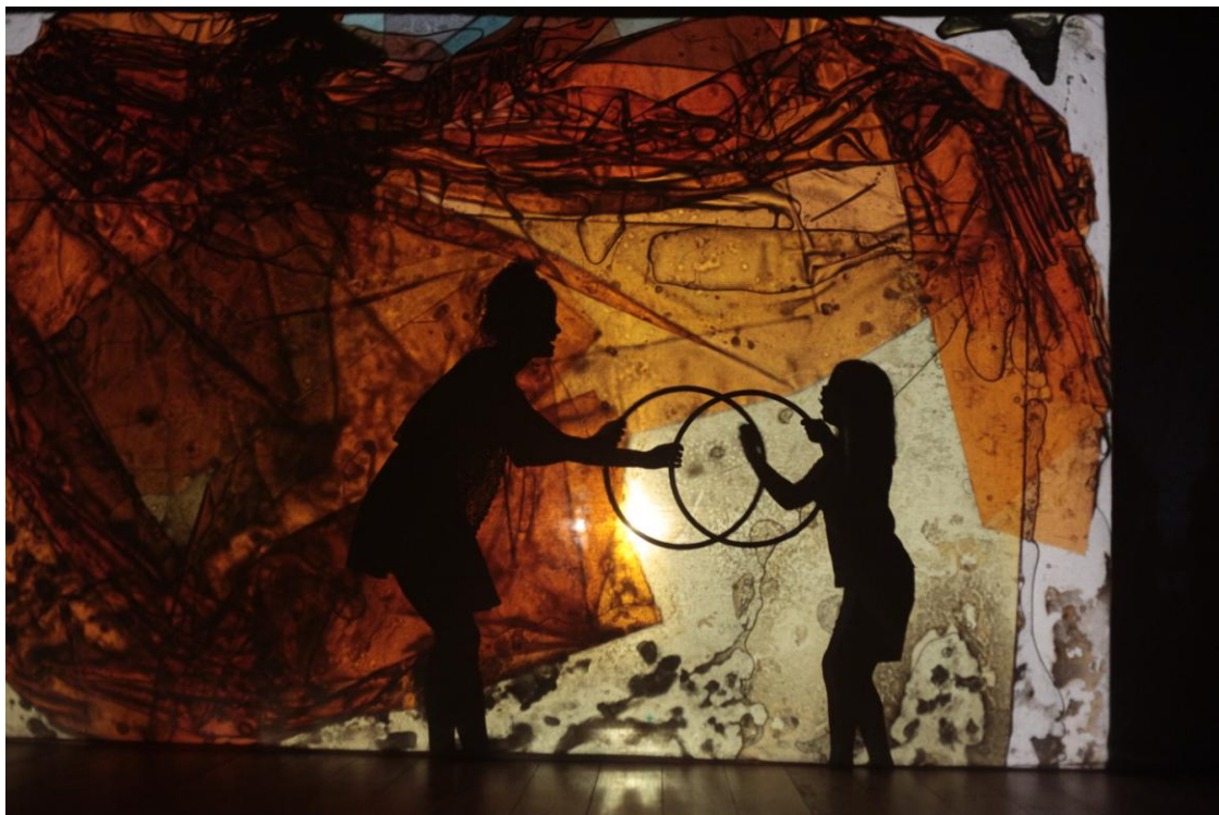
Ilustración 5. Autor. Different Art Education now . Fotografía digital independiente. Action X Change Summer Programme. Alcalá de Henares, 2013.

pausada (y no la acción apresurada), la seguridad (y no el miedo), y también, los intereses del alumno y su contexto, la horizontalidad entre el profesor y los estudiantes y así la dimensión humana del alumno y el profesor 19 . Opino que ante todo el alumno tiene que estar en el centro de todo diseño curricular y práctica educativa, no como un sujeto anónimo que debe cumplir con todos los objetivos establecidos para así aprobar, sino como un ser humano único, con sus sentimientos, con su bagaje personal y con todo su gran potencial para aprender. Es aquí donde el profesor jugará, o no, un importante papel.