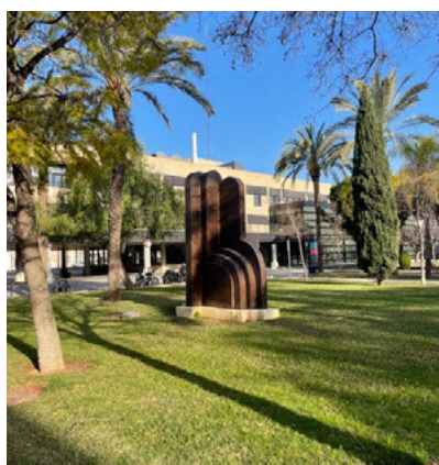
Fig. 2 Obra Còsmico demiurgo del artista Nassio Bayarri perteneciente al MUCAES de la UPV