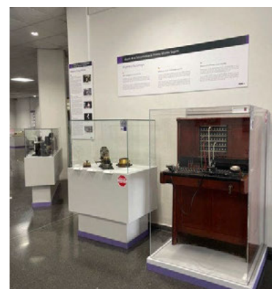
Fig. 4 Objetos pertenecientes al Museo de la Telecomunicación Vicente Miralles Segarra de la UPV

Los gestores y técnicos en Conservación y del Fondo de Arte y Patrimonio son los encomendados de la gestión y salvaguarda de las diferentes colecciones museográficas de la UPV. Dentro de sus competencias fundamentales podríamos destacar tres cometidos principales. Para la apropiada gestión de las colecciones, llevan a cabo un mantenimiento actualizado del inventariado y catalogación de cada una de las piezas patrimoniales. Al tratarse de colecciones distribuidas por las instalaciones de la Universidad, su inventariado facilita la localización de las obras además de evitar su pérdida temporal o disociación total. Otro de los requerimientos del equipo del Fondo es la difusión del patrimonio universitario. Para ello, además de realizar colaboraciones con instituciones externas a la UPV, como Universidades, Centros Culturales o Ayuntamientos a nivel local, nacional e internacional, se llevan a cabo seminarios y talleres didácticos que dan a conocer el patrimonio universitario, fomentando el interés artístico, histórico y científico tanto en usuarios universitarios como extrauniversitarios. 2 Además de ello, el Conservador del Fondo de Arte y Patrimonio, realiza una labor de análisis de los materiales constitutivos de las obras, para emplear las metodologías conservativas-restaurativas más acordes a las piezas y a su estado de deterioro, para conservar adecuadamente las