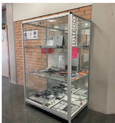
Fig. 3 Piezas pertenecientes al Museo de Informática de la UPV