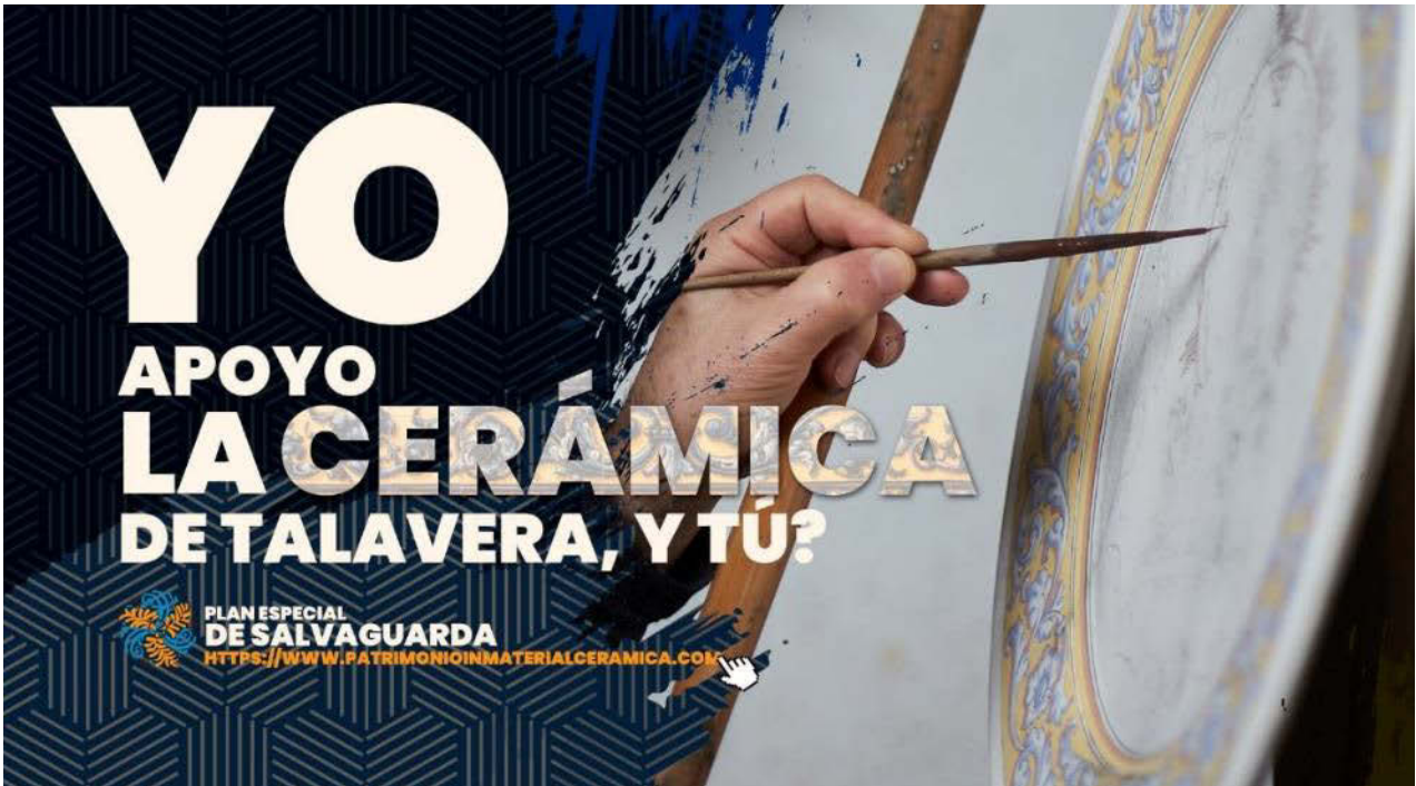
Fig. 1 Cartel promocional de promoción y participación. 2022

Con él se pretenden conservar las técnicas artesanales, visibilizar, sensibilizar y transmitir sus valores, en varias dimensiones que abarcan artesanía, cultura, economía, etc. Se perfila como una hoja de ruta o herramienta de coordinación interadministrativa y de participación social, así como la estrategia a seguir para la implementación de las actuaciones que se lleven a cabo en Talavera de la Reina, tendentes a la consecución del mantenimiento del bien inmaterial que nos ocupa.