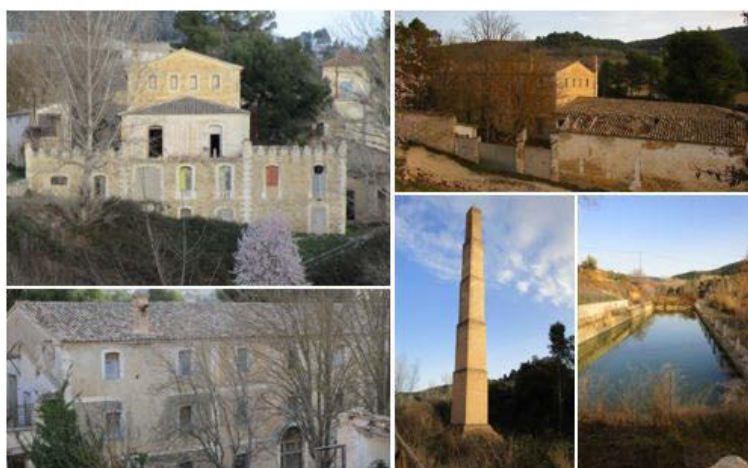
Fig. 5 Fotografías del estado actual del Molí Sol. Febrero de 2022

Se realizaron diversas ampliaciones en la margen derecha del complejo para viviendas, oficinas e instalaciones anexas al mismo. De modo paralelo al edificio central se construyó una nueva nave para poder albergar la maquina continua, junto a los locales de las dos calderas de vapor, se encuentran el centro de transformación eléctrica, lejiadoras, balsa de depósitos con pastas y el local para el lavado y trinchado de los trapos.