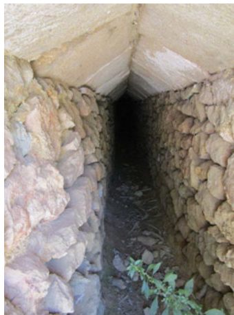
Fig. 2 "Alcavón" del Molí Sol. Acequia subterránea para el abastecimiento hidráulico del molino. Julio de 2021

En cuanto al aprovechamiento hidráulico de este tipo de molinos la secuencia es la siguiente: el agua del cauce del río es detenida y captada en parte por el azud, una especie de presa transversal que genera un estacamiento del agua desde el cual nace la acequia que abastece al molino, que puede ubicarse en superficie o, en ocasiones, como ocurre en este caso, y ante la necesidad de adaptarse a la orografía del terreno, construirse de forma subterránea, lo que se conoce como minado o "alcavón"(fig.2).