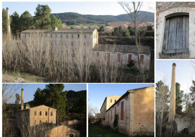
Fig. 4 Fotografías del estado actual del Molí Pont. Febrero de 2022

Su aspecto exterior es imponente pues puede apreciarse el edificio en su totalidad (fig. 4) si bien su interior está prácticamente hueco pues, debido al peligro de hundimiento, tuvieron que demolerse los forjados interiores. Asimismo, se renovó totalmente la cubierta y se cegaron los huecos de fachada para evitar accidentes.