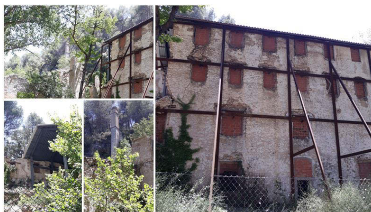
Fig. 3 Fotografías del estado del molí de l'Ombria. Julio de 2019

El cuerpo principal del molino constaba de una planta baja abovedada, sobre la que se levantaba otra planta dividida en dos secciones perfectamente delimitadas, estando la de la derecha cubierta con vigas de madera y la de la izquierda abovedada para contener el empuje del terreno, debido al gran desnivel del mismo en esta vertiente izquierda del río. Sobre ella, las plantas segunda y tercera destinadas al secado de papel, siendo culminado originalmente el edificio con una cubierta a dos aguas de tejas y tablillas de madera entre las vigas. Cubierta que, debido al deficiente estado de conservación en que se encontraba el molino, se derrumbó y debió sustituirse de forma urgente por la cubierta de chapa metálica que se aprecia en la actualidad.