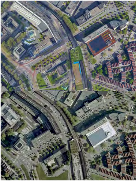
Figura 3. Prova climàtica ZoHo avui, després dels projectes de regeneració resilient al clima de De Urbanisten, i en el passat (2005).