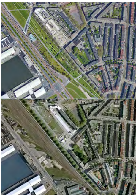
Figura 5. BoTu avui i en el passat (2005). Al mig, el pati de l'escola Dakpark, un dels bancs de proves de disseny en què havia treballat OOZE.

La investigació d'OOZE a través del disseny s'esforça per imaginar maneres en què la transició energètica pot servir com a catalitzador per aconseguir múltiples beneficis i millorar la qualitat de l'espai, tot implicant les comunitats locals durant tot el procés. Gràcies al seu enfocament integrat, l'estudi aborda diversos elements, inclosos aspectes climàtics, espacials, socials, educatius, financers i tècnics (Figura 5). Entre les intervencions estratègiques previstes, hi ha el projecte Dakparkschool i el pati interior d'illa, vist com una oportunitat per infondre al districte un nou punt focal verd que doni suport a les transicions locals. El pati paisatgístic representa un espai tecnonatural resultat d'un procés de disseny compartit, integrat i multidisciplinari.