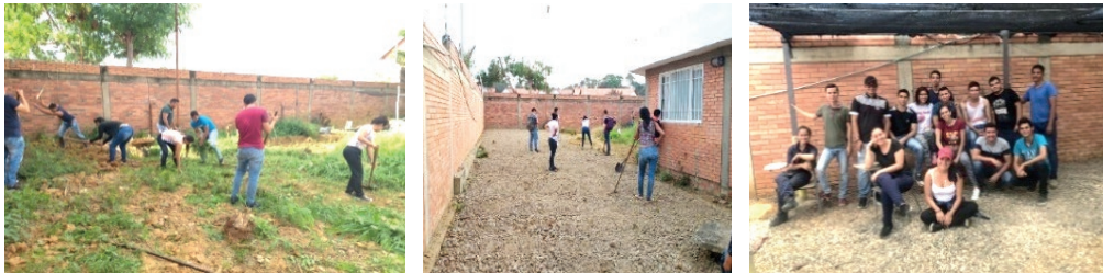
Figura 1. Proceso de limpieza y adecuación del lugar de trabajo para el desarrollo de los PA.

Los PA se ejecutaron durante el segundo semestre de 2019 y fueron agronómicos. Las condiciones climáticas del lugar se caracterizaron por una temperatura promedio mínima y máxima de 26,3 y 27,0 °C; la humedad relativa promedio fue de 67% variando desde 54 a 86 %; y la precipitación estuvo en 10,9 ml/día durante las semanas que se presentaron lluvias (Sepúlveda, 2020).