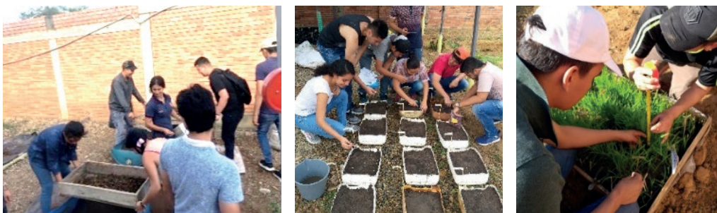
Figura 2. Actividades de manejo agronómico (cernir sustrato, siembra de semillas); y registro de datos según variables dependientes para el seguimiento de los proyectos de aula.

Algunas actividades de apoyo general para lograr el funcionamiento de los PA correspondieron al proceso de cernir la bovinaza seca, mezcla de los sustratos para la siembra, el riego de los cultivos y el desarrollo de actividades en laboratorio y en vivero (Figura 2).