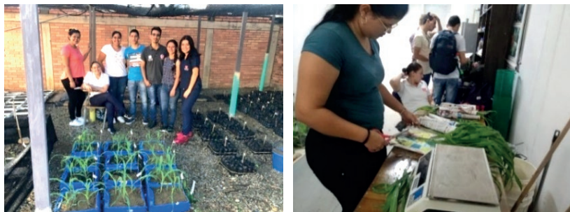
Figura 4. PA: Cultivo de maíz en DCA con tres densidades de siembra y tres repeticiones (unidad experimental pimpinas de color azul); se muestra el registro de datos (imágenes a la derecha).

A continuación se describen los dos proyectos que sobresalieron y culminaron exitosamente. El primero corresponde a un cultivo de maíz ( Z. mays ) en un DCA utilizando tres densidades de siembra como TTO, y como sustrato una mezcla de abono orgánico y arena (partes iguales). Se evaluó el porcentaje de germinación y la altura semanal de la planta (mm), adicional, 30 días después de la siembra se registró biomasa fresca (g) y materia seca (%) (Figura 4).