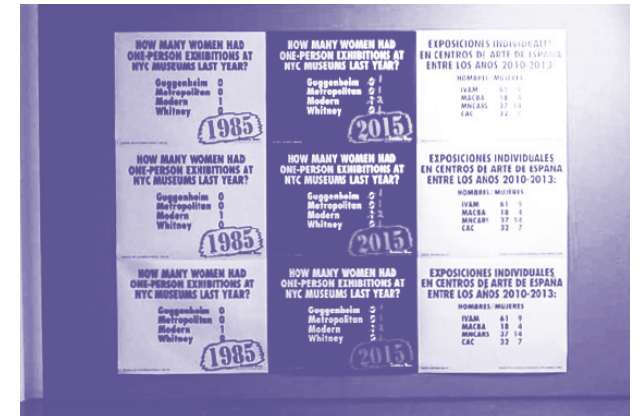
Fig. 2. Guerrilla Girls, Museum Recount 1985/2015, 2015 . Cartel 152 x 58 cm Montaje de la obra colectiva: Museum Recount , en la exposición Women in Work , 2017.