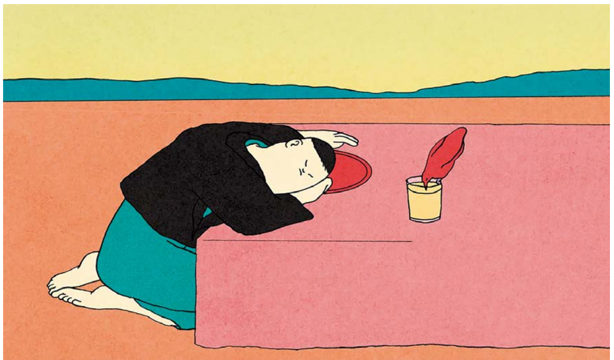
Figura 1. Viñeta de Cénit . María Medem, 2018