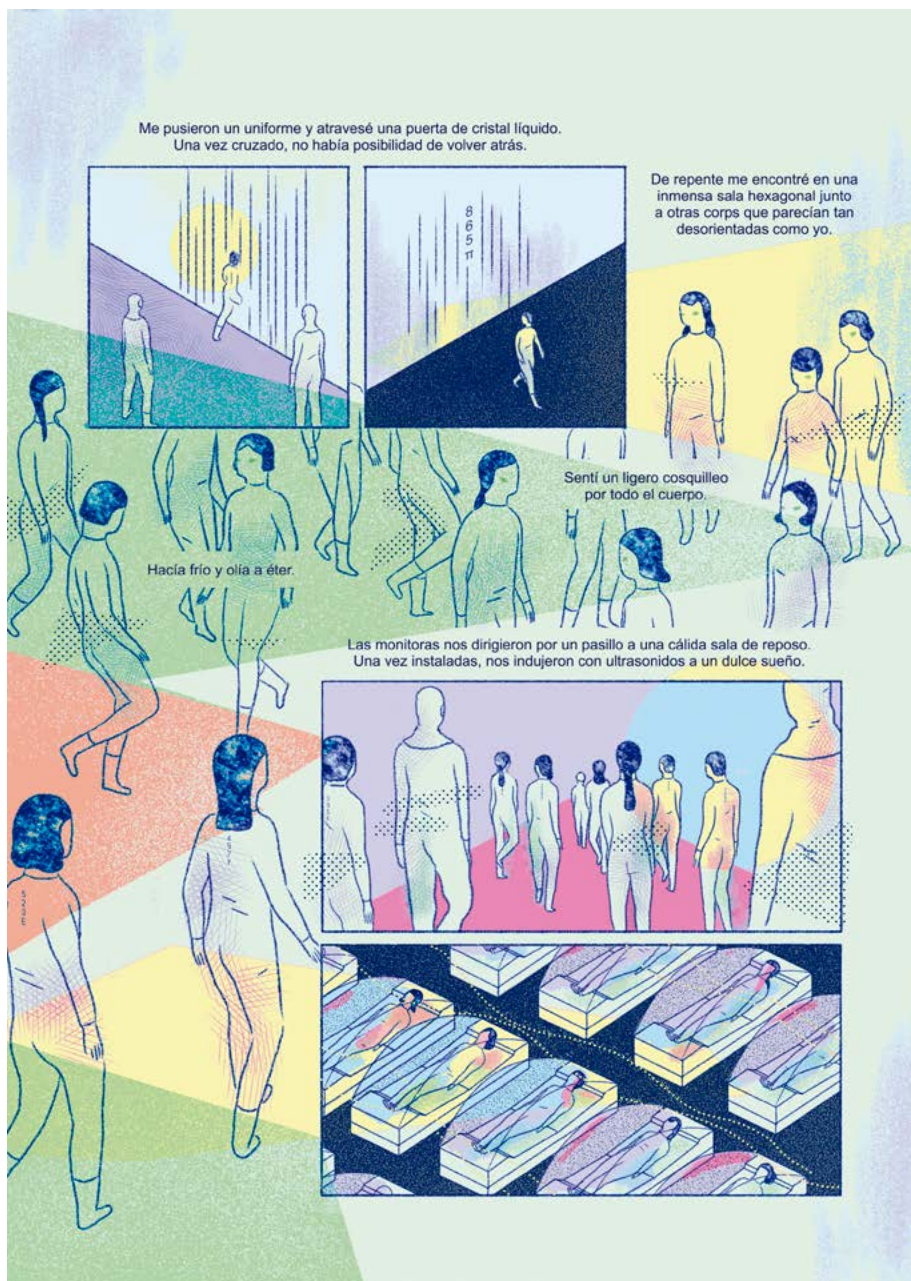
Figura 3. Pulse enter para continuar . Ana Galvañ, 2018

(parece que los tonos magentas y morados predominan en sus trabajos), tramas, texturas y degradados, con representaciones esquemáticas de las figuras humanas, que carecen prácticamente de rasgos, creando personajes singulares, experimentando con las composiciones de las viñetas y la página, generando en muchos casos, espacios imaginarios, fríos y asépticos. Todos estos recursos acompañan a la narración generando un halo de misterio y de atmósferas inquietantes, en mundos futuristas y deshumanizados, creando narraciones e historias anómalas, que requieren un esfuerzo por parte del lector, y que parece que es él mismo el que tiene dictaminar juicio sobre lo que se narra o la interpretación final, apelando a esa reflexión personal de cada uno, por lo que sus historias no tienen un único final, si no una