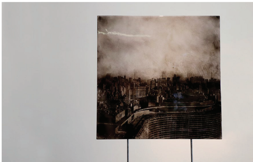
Figura 4. Civilidad. Foto detalle de la Instalación. Fotografía en óxidos minerales (cobalto, hierro y manganeso) y pólvora sobre fibrocemento, encapsulada con resina óptica. 2019.