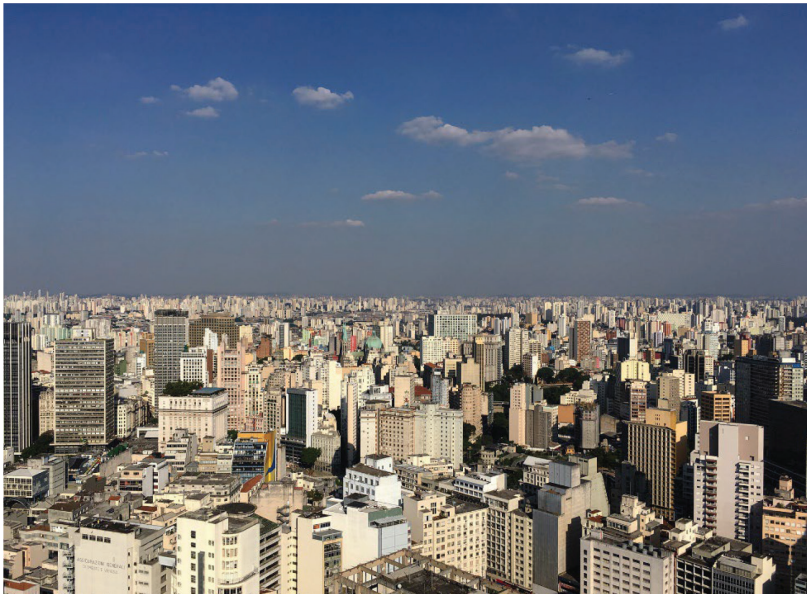
Figura 2. Imagen fotográfica tomada desde la terraza del Edificio Italia, São Paulo, Brasil.

La idea de paisaje ha cambiado, ya que somos capaces de producir muchas cosas a partir de la Tierra. Al crear combinaciones que antes no existían en el planeta, también llevamos el comportamiento humano a nuevos entendimientos sobre nuestra existencia y convivencia. Seguimos así la necesidad de ocupación vertical, porque si esto no fuera posible, el crecimiento poblacional ya habría ocupado y devastado gran parte de la corteza terrestre forestal y productiva, reduciendo nuestra capacidad de supervivencia.