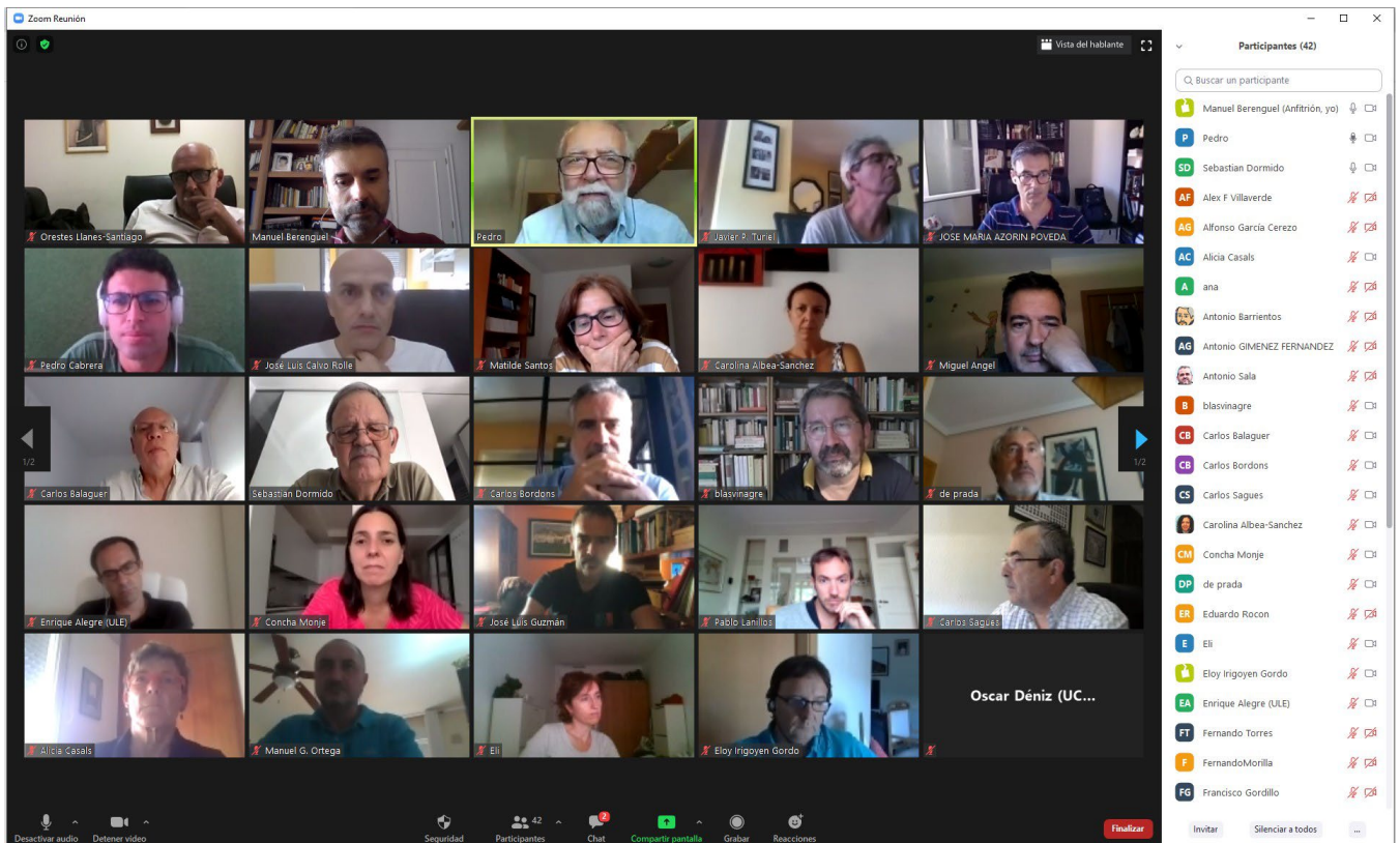
Reunión virtual del Comité Editorial el 31/08/2021

A lo largo de los años la composición del CE ha ido cambiando, porque se ha intentado que siempre el conjunto de ES incluya a los responsables de los grupos temáticos de CEA. También se ha fomentado la incorporación de investigadoras de referencia en el ámbito iberoamericano y se han llevado a cabo reuniones presenciales y telemáticas de la Dirección y también del CE, como reflejan las imágenes que acompañan a esta nota.