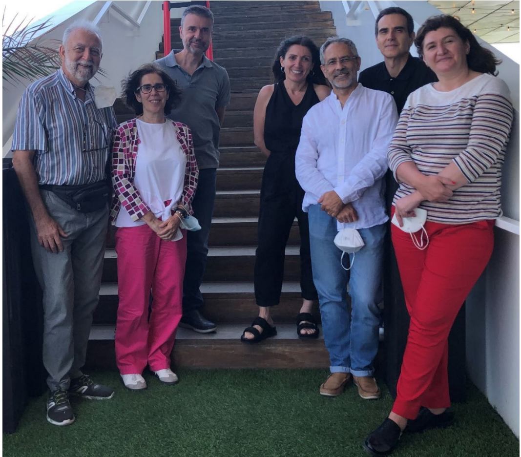
Reunión de la Dirección de RIAI en la Universidad Politécnica de Valencia el 23/06/2021