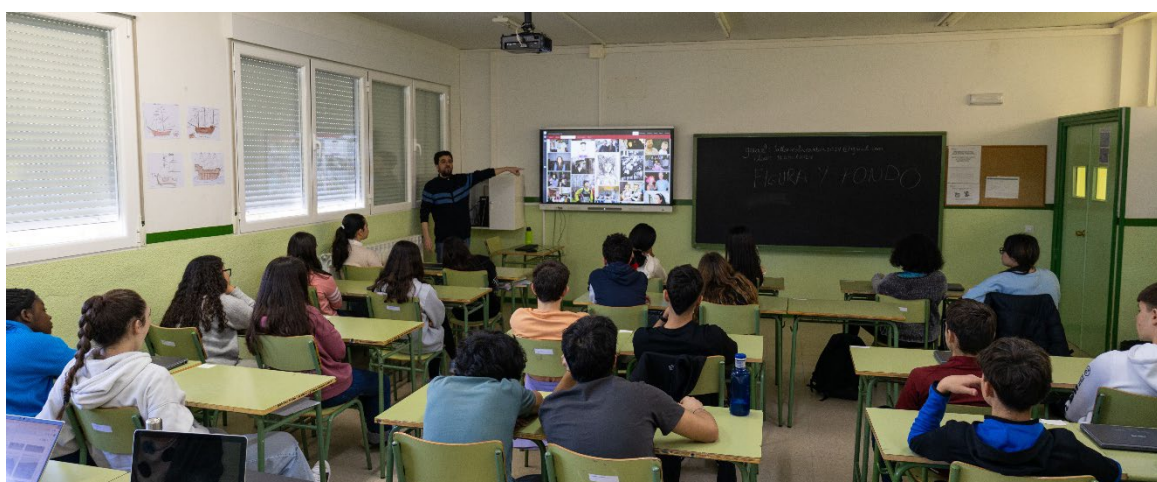
Fig. 1 Alumnado del IES La Rambla en el taller EL ARCHIVO Y EL FUTURO.

El taller titulado El archivo y el futuro , en el IES La Rambla de San Esteban de Gormaz invita al alumnado a establecer un diálogo entre las imágenes del pasado y las tecnologías del presente para plantear una mirada hacia el futuro tanto de la representación como de la propiedad de la tierra. En el Instituto de Educación Secundaria de la provincia de Soria se proponen varias acciones que utilizan IA para interrogar a las fotografías de archivo y provocar la generación de imágenes nuevas. Todo ello para contribuir a imaginar un futuro con otros modelos y diversas formas de habitar y de poseer la tierra. Abordaremos en este texto la experiencia en este taller que quiere aproximarse a la mirada hacia las fotografías que hacen genealogía por parte de quienes construirán las imágenes del mañana con las nuevas herramientas tecnológicas.