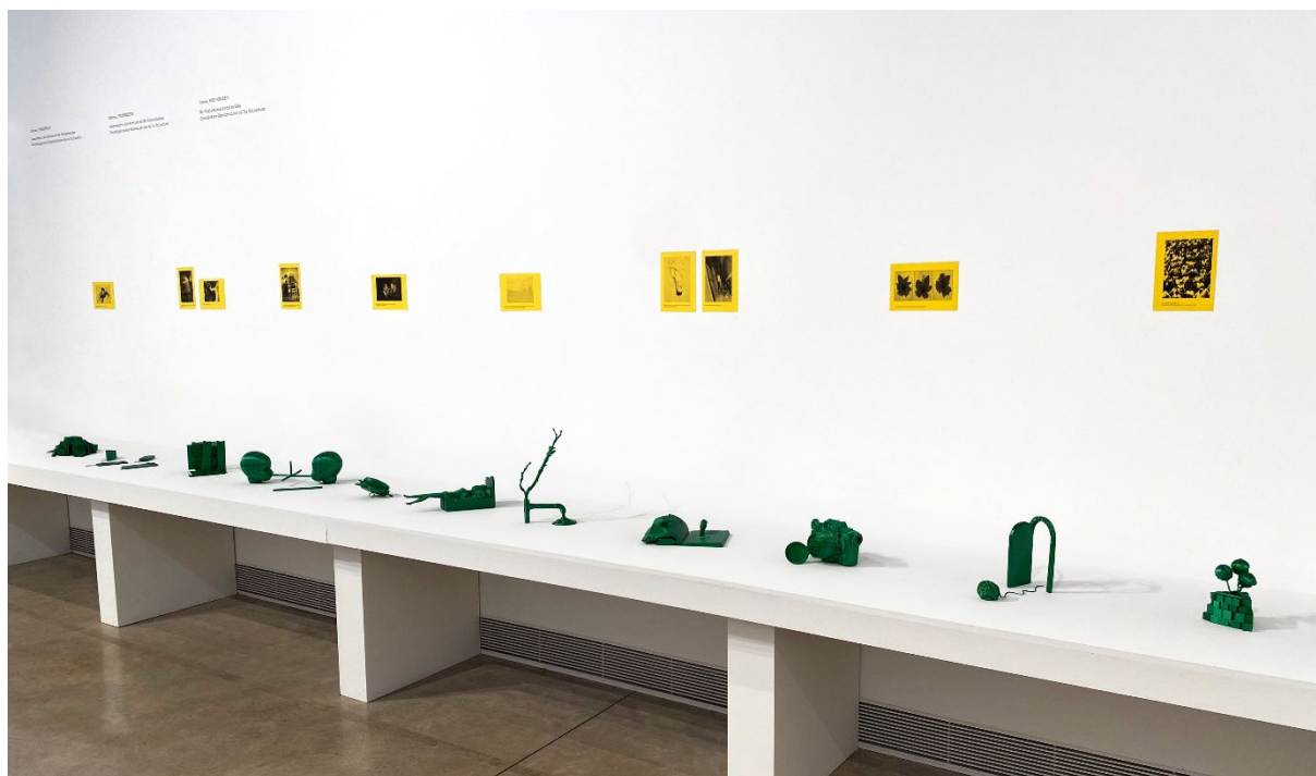
Fig. 9. Piezas expuestas en Bombas Gens Centre d'Art en la exposición Earth: A Retrospective .

De este modo, no sólo se daba continuidad al formato de laboratorios del programa expositivo de Bombas Gens que estaba en marcha durante la vigencia de la exposición sino que, además, los resultados producidos por los participantes se añadían al archivo original, convirtiéndolo así en una obra en evolución producto de las aportaciones de un grupo diverso de individuos, con un formato de obra abierta durante el transcurso de la exposición Earth: A Retrospective .