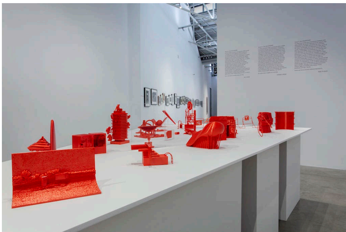
Fig. 4 Exposición Earth: A Retrospective en Bombas Gens Centre d'Art. Escena 4_Re-Colecciones.

En este laboratorio participó el estudiantado del Master in Design - Space and Communication: Contemporary Design Practices at Head-Genève, bajo la dirección y guía de El Último Grito, la aportación académica de HEAD: Arno Mathies y el apoyo técnico de Romain Chappet. A partir de una selección de fotografías de la Colección Per Amor a l'Art, el grupo de estudiantes trabajó con programas de diseño asistido por ordenador y tecnología de impresión 3D para producir una primera serie de objetos que se incorporaron al "Archivo de Re-Colecciones" de la exposición. Se trataba de materializaciones, interpretaciones y traducciones de lo representado en las imágenes, que fueron expuestas junto a las fotografías que las habían inspirado.