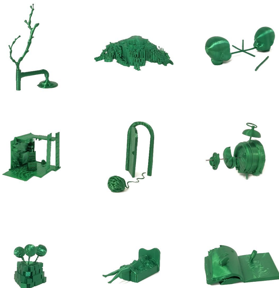
Fig. 8. Piezas realizadas con impresora 3D. Elaboración propia (2022)