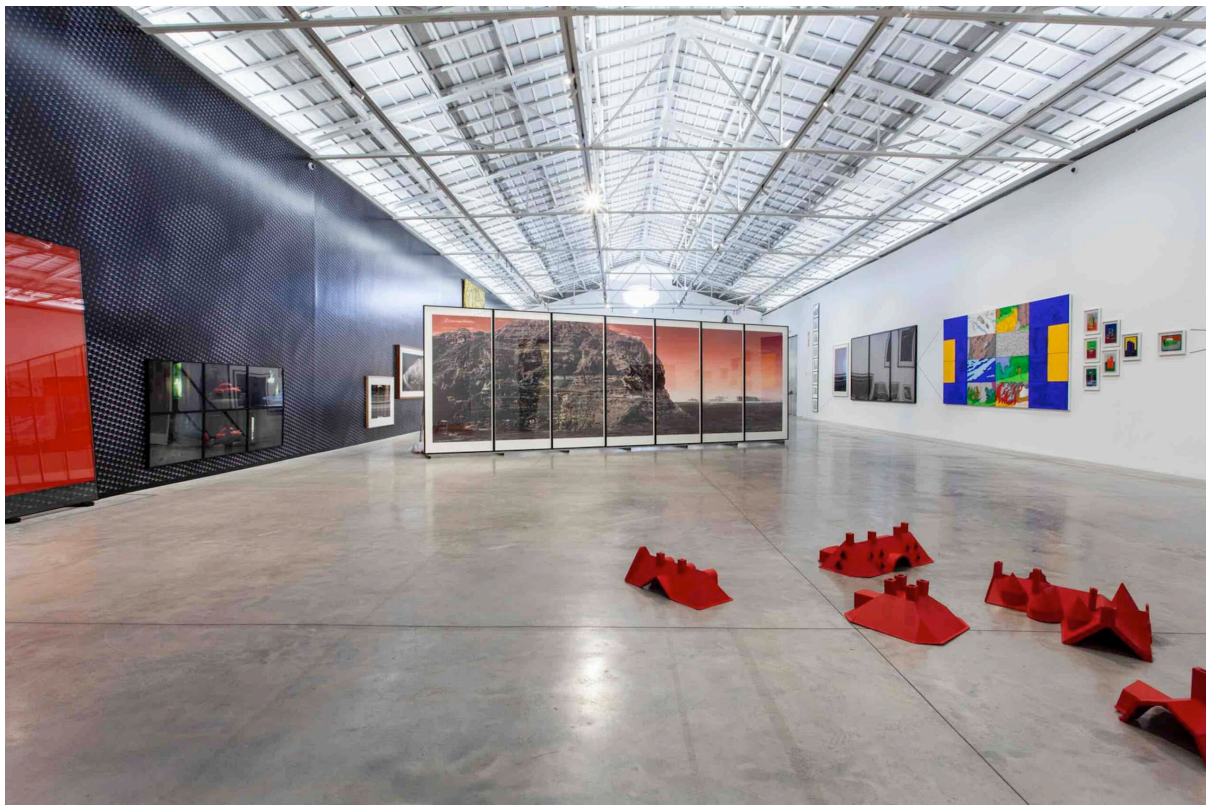
Fig. 1 Exposición Earth: A Retrospective en Bombas Gens Centre d'Art.