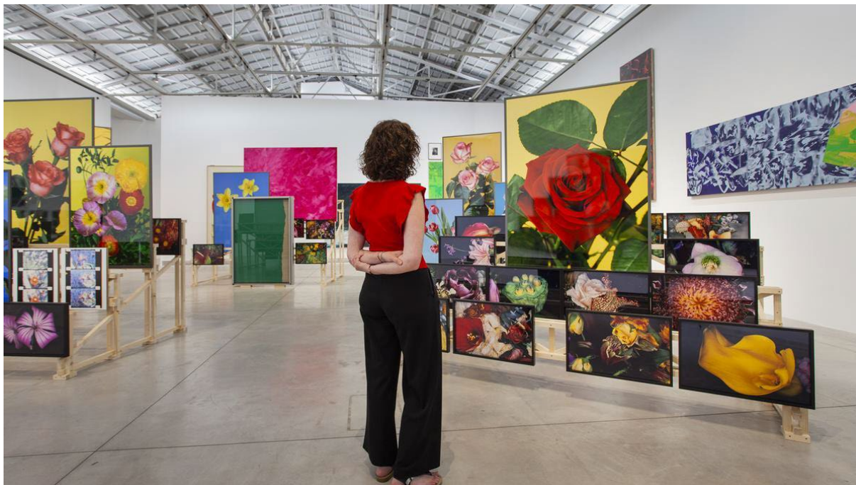
Fig. 3 Exposición Earth: A Retrospective en Bombas Gens Centre d'Art. Escena 2_Secuenciar. Fuente: ©Bombas Gens Centre d'Art. Foto: Zamora, Mario (2023)

estilo de un guion cinematográfico. Entre todas presentaban más de un centenar de obras, incluidas cuatro obras de El Último grito pertenecientes a la Colección Per Amor a l'Art. Todas ellas fueron cuidadosamente escogidas bajo los parámetros que ambos comisarios establecieron para diseñar la secuencia de escenas, como hilo conductor de la exposición 5 .