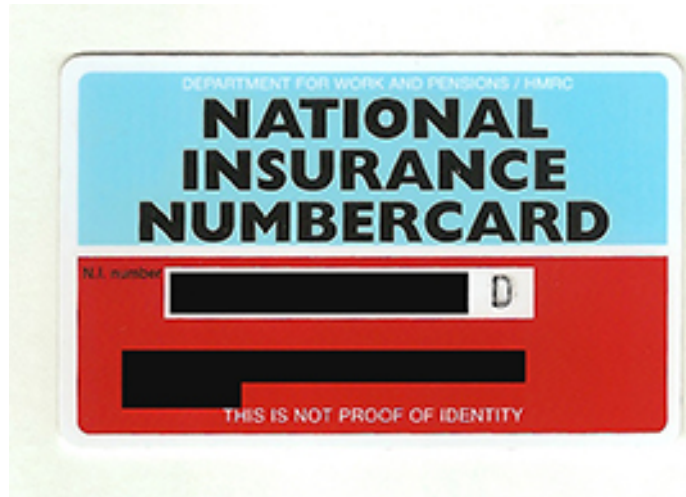
Fig. 3 National Insurance Number, Tarjeta Original .

Las actividades del colectivo se interrumpieron en 2018 debido al resultado del Brexit, lo que cambió el contexto legal y político, limitando sus acciones. Optaron por mantenerse en silencio hasta que se resolviera la cuestión del Brexit, ya que la salida del Reino Unido de la Unión Europea marcó el fin de su labor en la producción de documentos de identidad. Esta estrategia permitió a muchos inmigrantes asegurar su estatus en el Reino Unido, incluso en medio de la incertidumbre del Brexit. La ayuda inadvertida del caótico proceso del Brexit mejoró significativamente la calidad de vida de estos individuos y, en muchos casos, también benefició a sus familias.