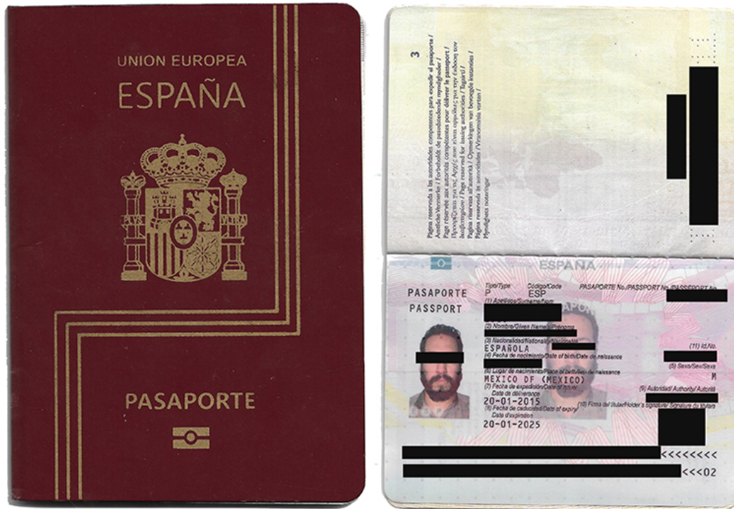
Fig. 1 Documento Creado por el colectivo.

El proyecto se originó en una reunión informal en un pub del este de Londres en 2015, donde un grupo de amigos y camaradas anarquistas de origen latinoamericano identificaron la disparidad salarial entre los trabajadores con documentación legal y aquellos sin ella como un problema fundamental relacionado con la migración.