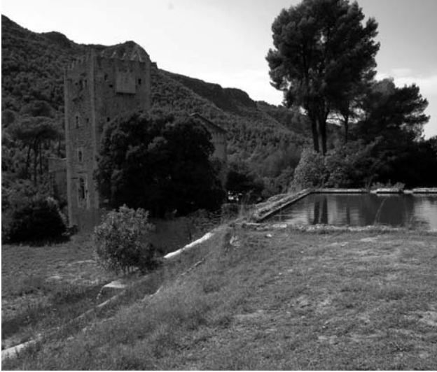
Figura 1. Monasterio de la Murta. Vista general