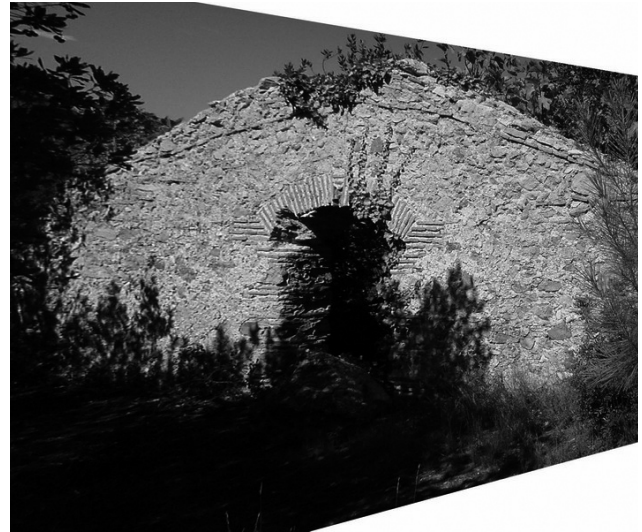
Figura 2. Pozo de nieve antes de la restauración