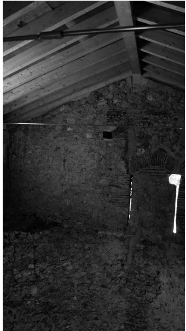
Figura 5. Vista interior del nevero después de la restauración

Los dinteles correspondientes a los huecos en los muros piñones estaban contruidos mediante rollizos de pequeño diámetro empotrados en la fábrica. Para desviar a las jambas las cargas de la viga de cumbre de cubierta, colocada en el plomo de estos vanos,