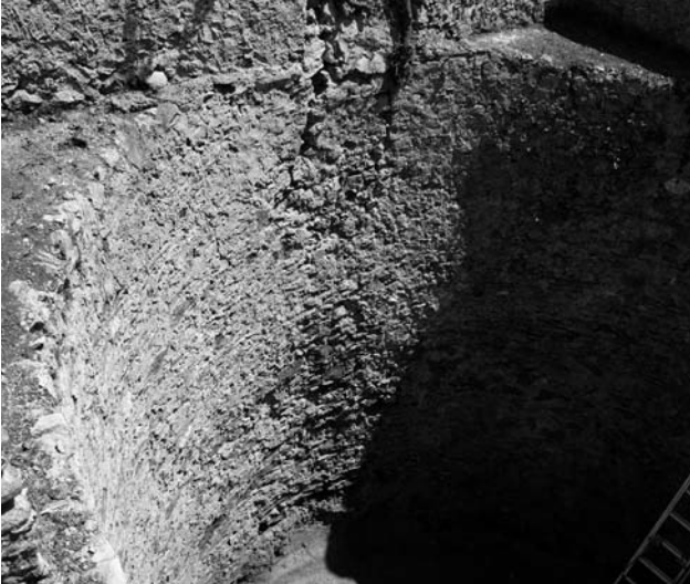
Figura 4. Profundidad del vaso donde se almacenaba la nieve