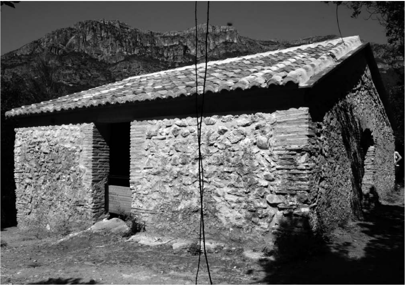
Figura 7. Vista del nevero después de la restauración

han reconstruido con fábrica de similares características a las de la original. La reconstrucción se señala mediante redondos de acero inoxidable empotrados en la junta que separa la fábrica original de la reconstruida. Se ha intentado que la intervención recoja y documente la historia constructiva del edificio, manteniendo todas las trazas.