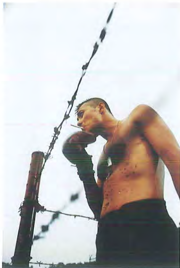
The Coast Guard

Time se presenta en España en el Festival de Sitges de 2006. Con un estilo nuevamente redefinido nos encontramos de nuevo ante un melodrama de amores des-