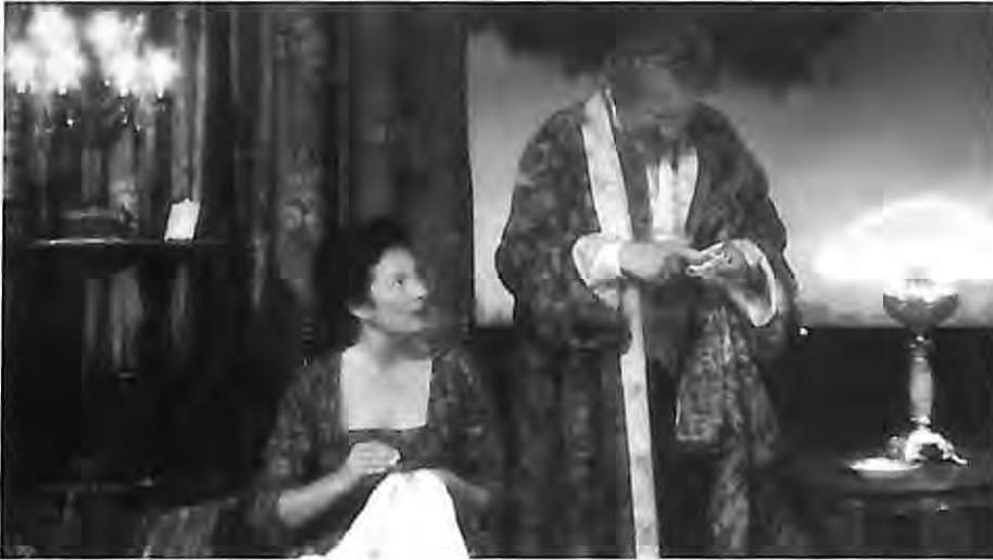
La Serva amorosa, 1995