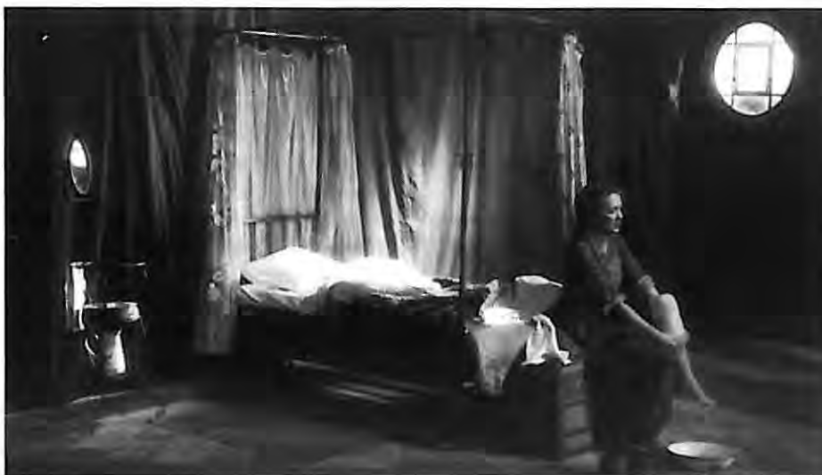
La Serva amorosa , 1995

La anécdota argumental puede ser resumida fácilmente: Ottavio, un anciano ricachón, ha caído en las redes de su segunda esposa, una viuda de mediana edad que intriga contra el hijo de Ottavio para que su hijo, Lelio, y ella misma puedan heredar toda la fortuna de su enamorado marido. En principio, nada nuevo ni especialmente llamativo dentro de la producción escénica de la época. Sin embargo, Goldoni, contra toda previsión, crea un texto enormemente moderno y actual gracias al personaje central de la obra, Coraline, la madura criada del señor Ottavio y su hijo, que toma cartas en el asunto y que decidirá el destino de la trama, sorprendiendo su protagonismo por su doble condición de mujer y de criada, un personaje que todavía hoy llegaría