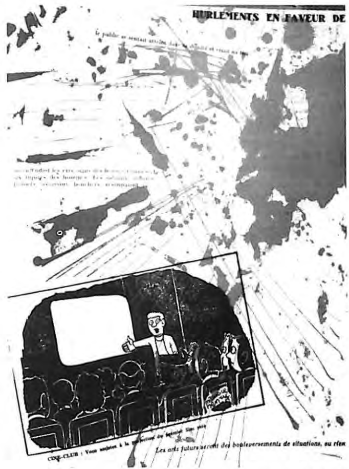
Mémoires, Guy Debord, 1959

Voz 3: Un importante comando de letristas, formado por una treintena de miembros. Todos cubiertos con ese uniforme sucio que es su única señal original, llegan a la Croissette con el firme deseo de provocar un escándalo susceptible de atraer sobre ellos la atención.